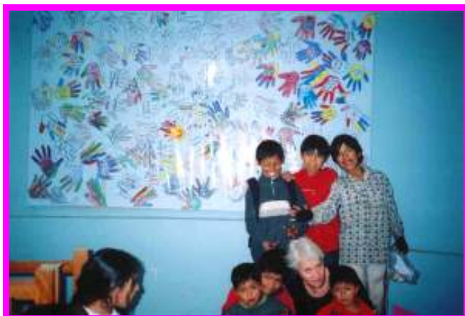
De prachtige wandlap van het Elzendaal College

Op dinsdag ga ik vol spanning naar mijn markt-mannetje, die als alles goed is een klus voor mij heeft geklaard. Afgelopen december heeft o.a. het Elzendaal College in Boxmeer een kerstmarkt georganiseerd, waarvan de opbrengst voor onze niños is.