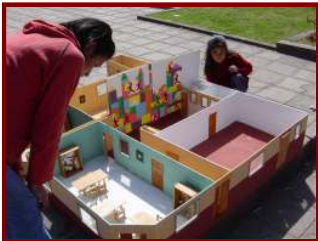
Een prachtige maquette van het opvanghuis

dering op de patio. De niños zelf gaven aan alle kinderen op het plein uitleg over hun opvanghuis en wat zij er zoal doen.