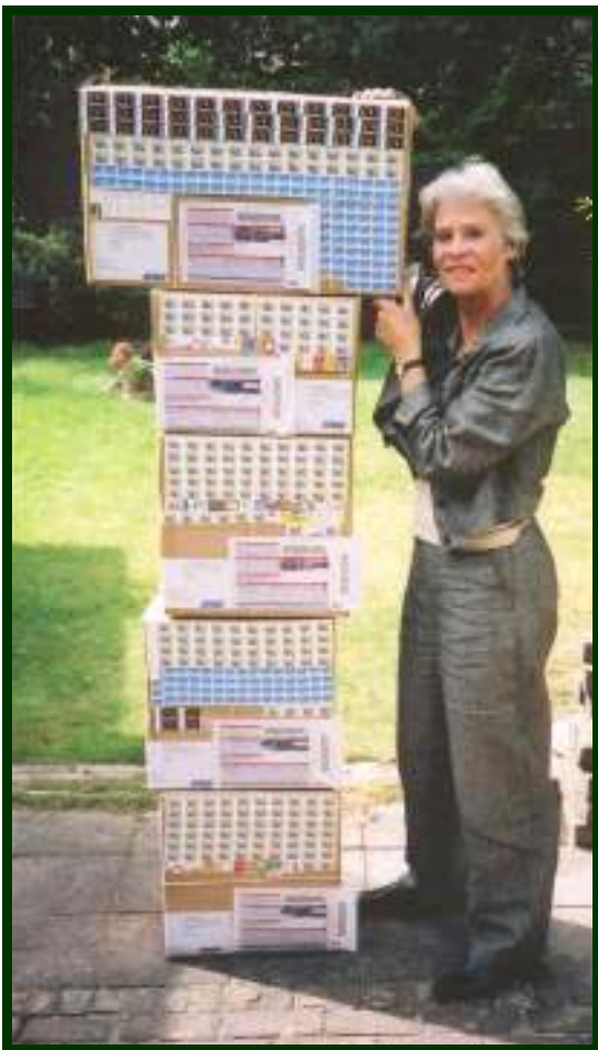
Een donatie van 487 postzegels