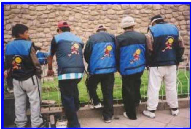
De schoenpoetsers met hun nieuwe bodywarmers

Voor deze mannen hebben we 5 bodywarmers gekocht waar we de naam Inti Huahuacuna op hebben laten naaien. Op deze wijze kunnen zij zich identificeren, horen zij ook ergens bij en hierdoor zou de Policia hen misschien meer met rust laten.