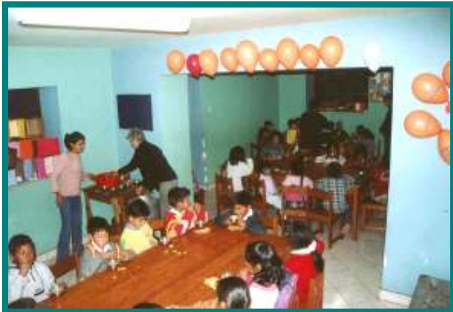
De doorbraak betekent een grote verbetering

En dan is het maandag en kan ik weer echt aan de slag met de niños. Onvoorstelbaar wat het team weer heeft gerealiseerd het afgelopen jaar! Dankzij de geweldige donaties is onze binnenplaats betegeld, een vies hok opgeknapt, de muur tussen het handvaardigheidslokaal en dit hok eruit gebroken waardoor het handvaardigheidslokaal groter is geworden. Ook hier is een tegelvloer gelegd, zodat we na het avondeten de vloer kunnen schrobben. Voor wat extra licht is er een raam ingemaakt.