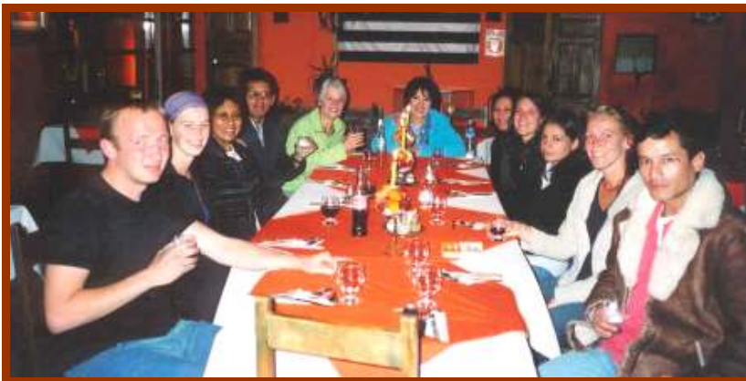
Door een donatie kon samen met het team en de vrijwilligers het 5-jarig-bestaan van de asociación Inti Huahuacuna worden gevierd.