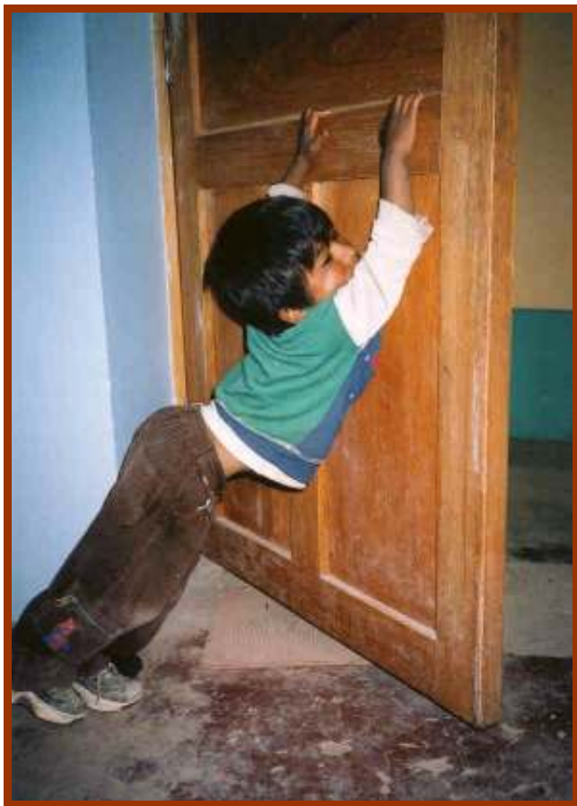
Deur naar vrijheden pas op een kier