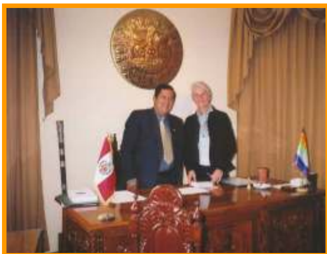
Een afspraak met de burgemeester

Om wat gewicht in de schaal te leggen tijdens mijn verblijf hier in Cusco heb ik ook nog een afspraak met de burgemeester geregeld.