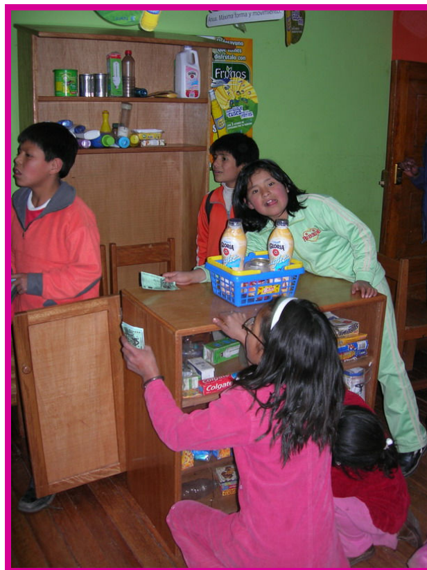
Winkelen is echt leuk!