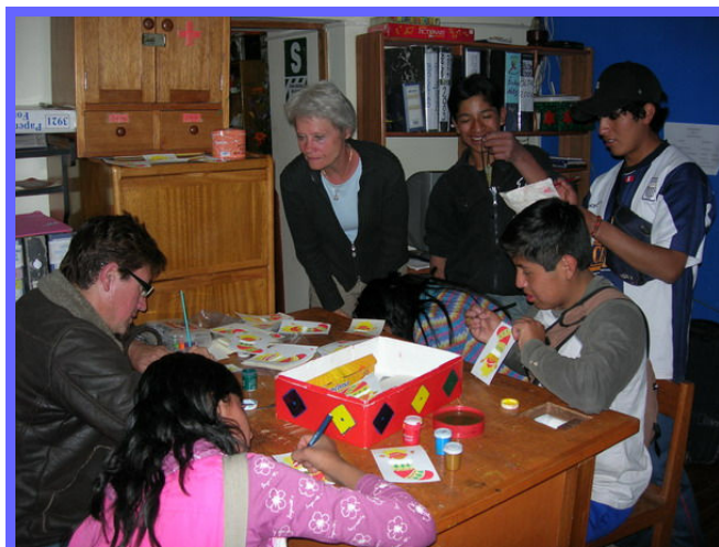
De jongeren werken mee aan de kerstkaarten.