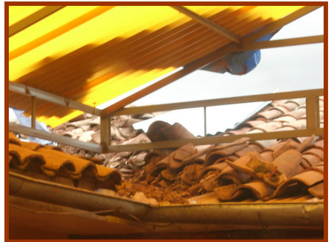
Het dak is hard aan vervanging toe.

krijgen, maar er zit niets anders op dan snel iemand te gaan zoeken die ons dak wil repareren.