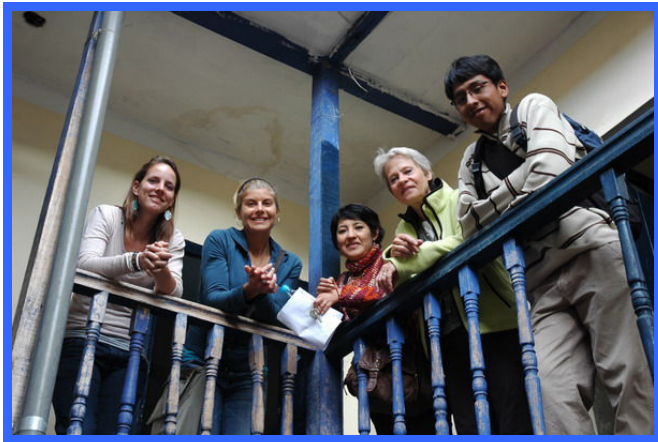
Vol trots genieten van de nieuwe aankoop.

Na de spullen opgeborgen te hebben gaan we naar onze grond kijken in de wijk Almudena, waar we ons nieuwe opvanghuis gaan bouwen.