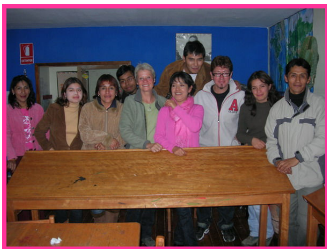
Het complete team van Inti Huahuacuna en Inti Ñan.