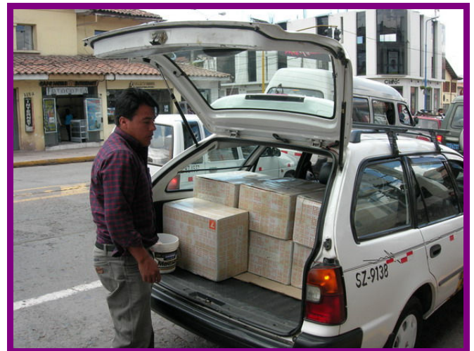
100 kilo in de taxi.

En dan is het maandag, de dag dat ik onze niños weer ga ontmoeten. Maar zoals altijd moet ik eerst naar het postkantoor, omdat een donateur 10 pakken van 10 kilo heeft opgestuurd.