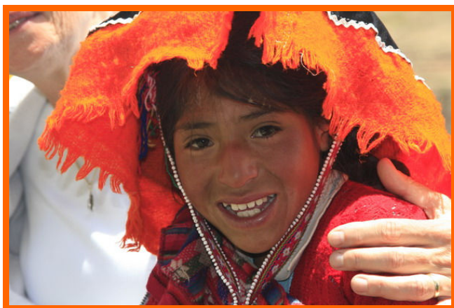
Een meisje in traditionele klederdracht.

Onze kinderen en ook deze jongeren, hebben nu of nooit in hun leven ook maar één kans gekregen en wie ben ik/zijn wij, als ook wij hun die kans niet kunnen bieden? Deze gedachten gaan tijdens de vergadering door mijn hoofd. Maar moet dit ten koste gaan van zoveel andere welwillende kinderen? Met dit soort vraagstukken loop ik hier rond en we besluiten om vrijdag nog een gesprek met deze groep te hebben. Daarna zullen we een definitieve beslissing nemen wat we met hen doen. Een Indiaanse traditie zegt dat je bij alles wat je doet, moet denken of dat voor de zevende generatie na jou een zegen zal zijn of een vloek. Nu beseffen jullie gelijk waarom zulke beslissingen ons zoveel kopzorgen kosten!