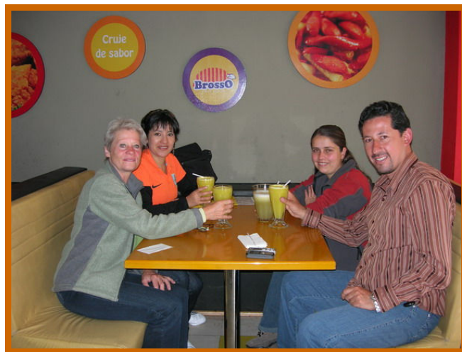
Een toast op de bouw van ons opvanghuis.

Het hangt met de benen buiten bij de notaris, maar anderhalf uur later staan we buiten met een getekend contract.