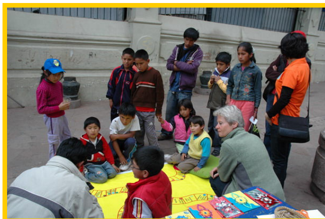
Een door Prof. Flor ontworpen spel voor groot en klein.

catieve projecten. Ieder project laat die dag iets zien van wat zij met de kinderen doen. Alle kinderen van de projecten zijn straatverkopertjes en de kinderen zelf moeten aan de mensen laten zien hoe en wat ze maken in hun project. Flor heeft een ontzettend leuk idee bedacht om ook een gezelschapsspel te maken over de rechten van het kind. Dat een kind bij de geboorte het recht heeft op een goed leven, een naam, gezondheidszorg, het wonen bij een gezin, goede voeding en scholing.