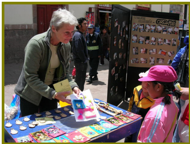
Een expositie van ons werk op het Plaza San Pedro.