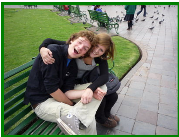
Na aankomst op een bank van het Plaza de Armas.

Volgens deze 3-stappenmodule hebben we voor zo'n 30 personen een groot Peruaans diner bereid en iedereen gul laten geven voor de Peruaanse niños. Ook hebben we al het cadeaugeld van ons afscheidsfeest gedoneerd aan de 'Kinderen van de zon'. Nou is dit uiteraard niet verplicht, maar het voelt goed om ook financieel wat bij te kunnen dragen en je hebt meteen een goede start zou ik zo zeggen! Afijn, ik zal wat vertellen over ons verblijf in Cusco.