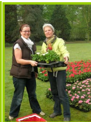
Geraniumactie Zwijzen College.

De scholen zamelden daarna geld in door het organiseren van bijvoorbeeld een sponsorloop, de verkoop van geraniums, een circus of een markt. Maar ook instellingen droegen bij met hun acties. Zo hield een studentenclub een Perudag; kregen we de opbrengst van de verkoop van tweedehands boeken; mochten we delen in de opbrengst van de Trap-In en hield het koor van de Udense culturele instelling een zanguitvoering.