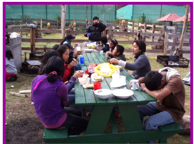
Een heerlijk ontbijt na een spannende nacht in de tent.

Eindelijk is het zover! Vandaag gaan alle kinderen van Zarzuela en Tica Tica met de bus naar Pisac. Het wordt een spannende reis, want we blijven daar ook een nacht slapen. Pisac ligt heel ver weg van Cusco, want we moeten wel meer dan een uur in de bus zitten. Toen we met de bus in Pisac aankwamen gingen we eerst te voet naar de kampeerplaats. Daar gingen we lekker eten. We kregen soep, worstjes met aardappelen, en limonade met koekjes. Daarna gingen we spelletjes doen en dat was heel gezellig. Ik vond het park dat er bij lag heel mooi, want daar mochten we op de trampoline springen. De profesores hadden ook een fototoestel meegenomen en we hebben mooie foto's gemaakt.