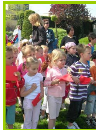
Sponsorloop 't Mulderke.

Op diverse scholen in Uden en omstreken mocht ik een presentatie verzorgen.