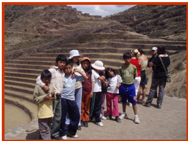
De niños bezoeken de Inca-ruïnes van Pisac.

Toen we wakker werden begonnen we de dag met een ontbijt. Que rico! Wat lekker, om de dag zomaar met een ontbijt te beginnen. Daarna gingen we naar de ruïnes van Pisac.