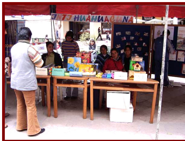
De niños presenteren hun zelfgemaakte creaties.

vertellen, literatuur, theater en poppenkast en op welke wijze bied je onderwijs aan moeilijk lerende kinderen.