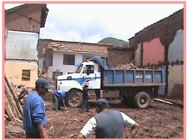
De sloop van het oude pand.

Na goedkeuring van de sloopbegroting en het opstellen van een door de notaris ondertekend contract kon men op maandag 5 januari 2009 beginnen met de sloop. Onze grond bevindt zich in een smalle eenrichtingsweg en dit betekent dat het moeilijk is om al het puin af te voeren. Daarom hebben we ook een aanvraag ingediend en een bedrag moeten betalen, waardoor we een week lang tijdens de avonden en 's nachts de straat af mogen zetten zodat een vrachtwagen het puin kan afvoeren.