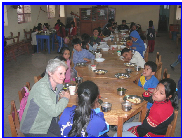
Het afscheidsfeest van Inti Ñan.

Stil, en met een brok in onze keel, gaan we tezamen in de donkere avond terug naar huis. Er blijft toch altijd nog een verschil in weten dat je het goed doet en voelen dat je het goed doet.