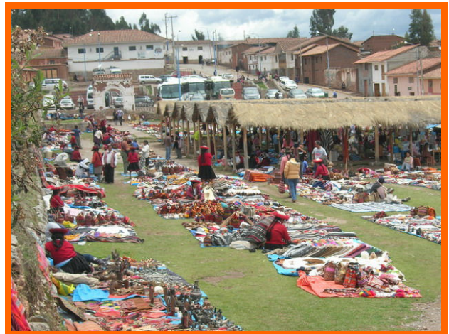
De markt in Chinchero.

kunt kijken, lijkt me niet gemakkelijk. Ook de kinderen van Inti Huahuacuna worden sterk beïnvloed door deze moderne invloeden.