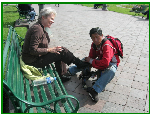
Uitrusten en een schoenpoetsbeurt op het Plaza.