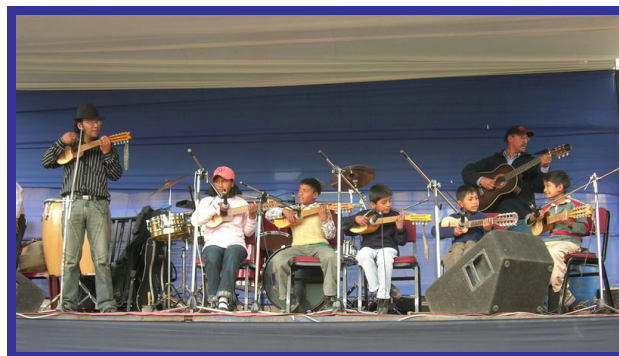
Het optreden van de niños in de stad.

ziekdocent ter beschikking gekregen, die de kin- deren muzikles hebben gegeven. Enkele van onze niños kregen les in het bespelen van de charango. Vandaag is hun grote optreden, samen met kinderen van vele andere projecten. En dan eindelijk, bijna als laatste, mogen onze kinderen hun muziekstuk ten gehore brengen. Ze doen het werkelijk geweldig! Onder begeleiding van de charango zingen ze een prachtig Peruaans lied. Na onze niños uitgebreid gefeliciteerd en be- dankt te hebben, gaan we naar de bouw van ons nieuwe opvanghuis.