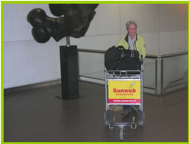
De grote reis kan beginnen.

Als ik me ooit gerealiseerd heb dat een mens altijd onderweg is, dan is het wel de afgelopen weken. Wat is er ongelofelijk veel moois op mijn pad gekomen en wat ben ik dankbaar voor dit alles! Het leek wel of ik in een achtbaan zat, die net op tijd zou stoppen voor mijn vertrek naar Peru. Maar dan is het toch ineens weer zover, dat ik afscheid moet nemen om mijn reis te aanvaarden. Al dagen voel ik bij vlagen een onrust en een zorg of het me ook deze keer weer gaat lukken, want mijn doen-lijst is weer lang.