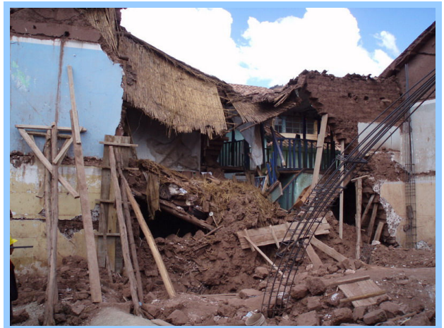
De ingestorte muur van de burens.