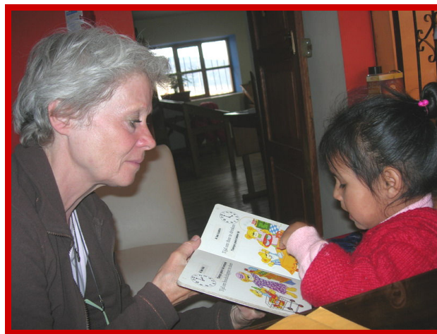
De rijkdom van het boek.

plaatje gilt ze heel enthousiast "Mira, mira", "Kijk, kijk" en in een gebrekkig kindertaaltje vertelt ze me het hele verhaal uit het boekje. Bij het plaatje waar het beertje zich uitkleedt om naar bed te gaan zegt ze, dat haar moeder gezegd heeft dat ze haar schoentjes aan haar voetjes zal plakken als ze die verliest, en ook dat mama gezegd heeft dat ze op de grond moet blijven slapen en pas een echt bed krijgt als ze nooit meer in haar broek plast. Met een heel wijs koppie zit ze als een oud wijfie haar lief en leed met me te delen. Vervolgens keutelt ze weer mooi naar de bibliotheek om een nieuw boek te halen. Steeds zie ik in de bibliotheek wat het toch een geschenk is om boeken te hebben. Ik heb eens gelezen dat Cicero schreef dat een huis zonder boeken, als een lichaam zonder ziel is. Ik begrijp helemaal wat hij bedoelt. En wat zou ik graag nog meer boeken voor de kinderen hebben. Kinderen zijn van nature nieuwsgierig en hebben een tomeloze fantasie. Het plezier van lezen in hun eigen taal bevordert de alfabetisering en kinderen worden trots op zichzelf en hun eigen cultuur. Het lezen van boeken opent deuren naar kennis, vrijheid en vooruitgang en hopelijk ooit naar een toekomst voor al deze vergeten, achtergestelde kinderen.