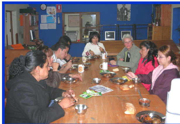
Mijn afscheidsvergadering met het team.

Lieve allemaal, het zit er weer op! Ik heb weer vele rijke en kostbare momenten mogen beleven met onze niños en het team. Wat ben ik hen hier dankbaar voor! Met een zeer voldaan, maar ook verdrietig gevoel, heb ik gisteravond afscheid genomen van het team en onze niños. Ook jullie wil van harte bedanken, want ik realiseer me vooral dat wij alleen maar met jullie steun de ingeslagen weg kunnen blijven bewandelen. Uiteindelijk zullen we dan allemaal tezamen onze droom waar maken, een beter leven en een toekomst voor de niños van Inti Huahuacuna. Ik hoop intens dat ik, samen met jullie, nog vele jaren het team van Inti Huahuacuna kan en mag blijven steunen, zodat de zon niet alleen gaat schijnen, maar ook blijft schijnen, voor de Kinderen van de Zon. Mijn laatste verslag wil ik eindigen met een Peruaanse wens: