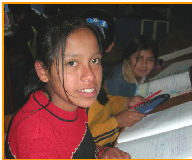
De meisjes van Tica Tica vinden hun weg naar Zarzuela.

Vrijdagmiddag zie ik ineens een paar kinderen van Tica Tica bij ons binnen komen lopen. Wat doet dit me ongelooflijk goed! Hier had ik steeds op gehoopt, maar aangezien de wijk Tica Tica zo ver van Zarzuela aflight, was ik bang dat de kinderen zouden wachten tot ons huis in de wijk Almudena af is. Ik heet hen van harte welkom en zeg hen dat ik hoop dat ze regelmatig zullen blijven komen.