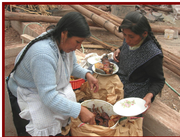
Heerlijke cuy op de dag van de bouw.

Vandaag is het el día de la construcción, de dag van de bouw, en dat wordt gevierd door alle bouwvakkers een overheerlijke lunch aan te bie- den. De architecte heeft ons gevraagd bij deze lunch aanwezig te zijn. Op de bouw zitten twee Peruaanse vrouwen met enorme zakken, waar de lunch inzit, op ons te wachten. Ook vandaag heb ik er rekening mee gehouden dat dit wel eens niet helemaal mijn favoriete lunch zou worden en ik heb brood met kaas meegenomen. En maar goed ook!