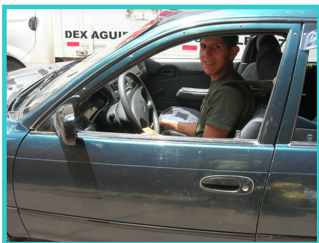
Jesus als taxichauffeur.

Binnenkomen bij Inti Huahuacuna voelt altijd weer als thuiskomen. Ondanks dat ik dolgelukkig ben met de bouw van ons eigen nieuwe opvanghuis, weet ik dat ik dit huis in Zarzuela echt zal missen. Hier is het allemaal begonnen, hier ligt echt mijn hele ziel en zaligheid en dat zal ik