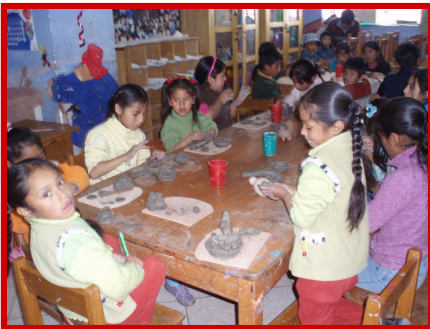
Keramieklussen tijdens de vakantieperiode.

De keramiekleraar is heel goed en mijn werk is erg goed gelukt. Gelukkig mocht ik van Inti Huahuacuna mijn werk mee naar huis nemen om aan mijn ooms te laten zien en ze feliciteerden mij, omdat ze mijn werk heel mooi vonden.