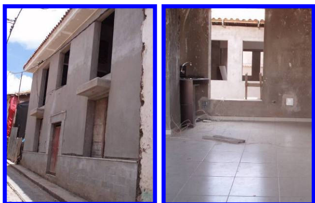
Het pleisterwerk is bijna klaar en de tegels zijn gelegd.

In maart zie je de ruimtes steeds meer vorm krijgen. Het meeste stukadoerswerk is achter de rug. Er is een mooie tegelrand gemetseld aan de onderkant van de voorgevel en rondom de voordeur. In de verschillende ruimten worden tegelvloeren gelegd. Er worden wastafels geplaatst en de grote patio wordt verhard. Er is gestart met de betegeling van de sanitaire ruimten en de keukens.