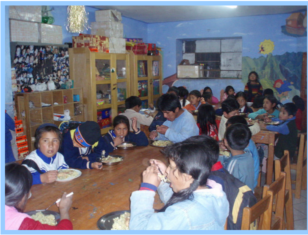
Dankzij extra donaties een heerlijke voedzame maaltijd.

De keramiekleraar is heel goed en mijn werk is erg goed gelukt. Gelukkig mocht ik van Inti Huahuacuna mijn werk mee naar huis nemen om aan mijn ooms te laten zien en ze feliciteerden mij, omdat ze mijn werk heel mooi vonden.