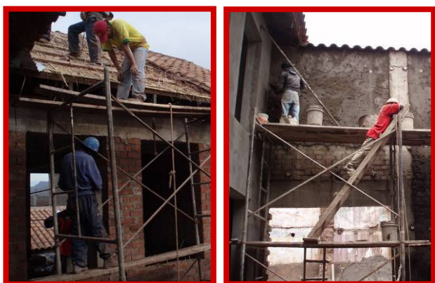
De pannen worden gelegd en de muren gestukadoerd.

In januari 2010 wordt de dakconstructie aangebracht en in februari start men met het stukadoeren van het gebouw en worden de pannen gelegd. In Peru is het gebruikelijk om het gehele gebouw te stukadoeren. Dat is een hele klus, want het gaat over veel m 2 . Ook de adobemuren van de burens, die grenzen aan de patio, worden behandeld om een mooie uitstraling te krijgen.