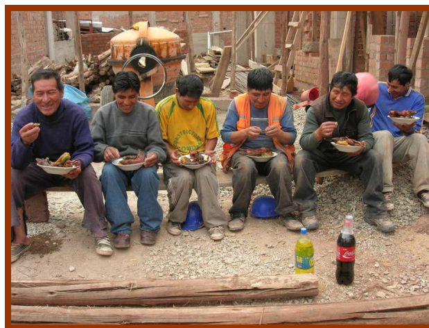
De bouwvakkers vieren de dag van de bouw.

In januari 2009 is begonnen met de sloop van de oude opstallen. Met enige vertraging, in verband met het verkrijgen van de benodigde bouwvergunningen, is op 13 juli 2009 het contract voor de bouw getekend en kort daarna is de bouw gestart. Op 23 september is de bouwploeg een ernstig ongeluk overkomen. Tijdens hun werkzaamheden is, ondanks alle voorzorgsmaatregelen, een scheidingsmuur van adobe van de burens ingestort. Dit ongeluk was een zwarte dag in de geschiedenis van Inti Huahuacuna. Enkele weken later kon de bouw pas weer worden voortgezet. De bouwwerkzaamheden zijn vanaf dat moment vlot verlopen.