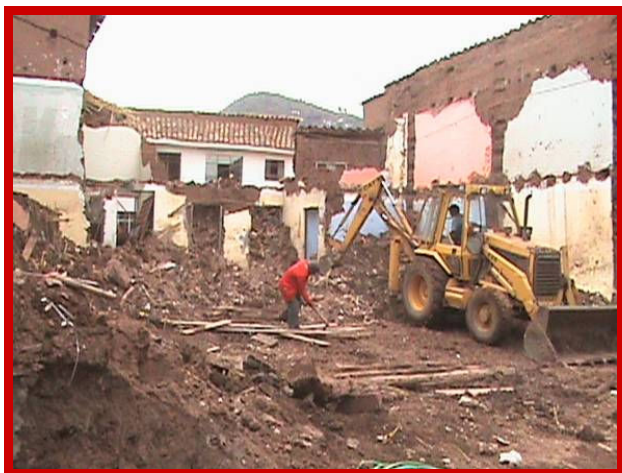
De oude opstallen zijn gesloopt.

Na een intensief onderzoek naar betaalbare bouwlocaties heb ik, tijdens mijn verblijf in Cusco in oktober 2007, een perceel grond gekocht in de wijk Almudena. De aankoop, inclusief kosten, bedroeg afgerond €81.000. In 2008 zijn we in Nederland gestart met een grote wervingsactie. Na op weg te zijn geholpen door een bevriende architect Goyo is eind 2008 contact gelegd met architecte Blenda Rosas en is zij begonnen met het tekenen van de bouwplannen. We zijn in 2008 begonnen met het verwerven van (extra) donaties om de nieuwbouw te kunnen financieren. Gezien het benodigde bedrag gingen wij er medio 2008 voorzichtigheidshalve nog vanuit dat de bouw in 2 fasen moest worden gerealiseerd. Uit latere berekeningen van de architect is ons gebleken dat het gunstiger was om de bouw in één keer af te ronden. De sloop- en bouwkosten met inrichting werden geraamd op €248.500. Het hele jaar 2008 en 2009 is er veel tijd ingestoken om gelden voor de bouw te verwerven. Met veel plezier kijken we terug op de leuke acties en de vele spontane reacties van mensen en hun betrokkenheid. Dankzij bijzonder gulle giften van enkele anonieme schenkers/fondsen konden wij begin 2009 groen licht geven om het gebouw in één fase te bouwen.