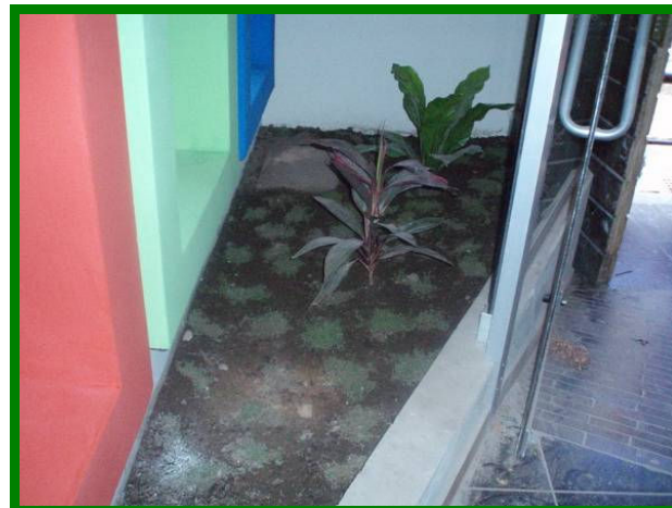
Er is ook aan wat groenplekjes gedacht.

De grote patio is vooral als speelveld bedoeld. De kleine patio krijgt het karakter van een binnentuin. De architecte heeft ervoor gezorgd dat er op meer plekken in het gebouw plantenhoeken komen.