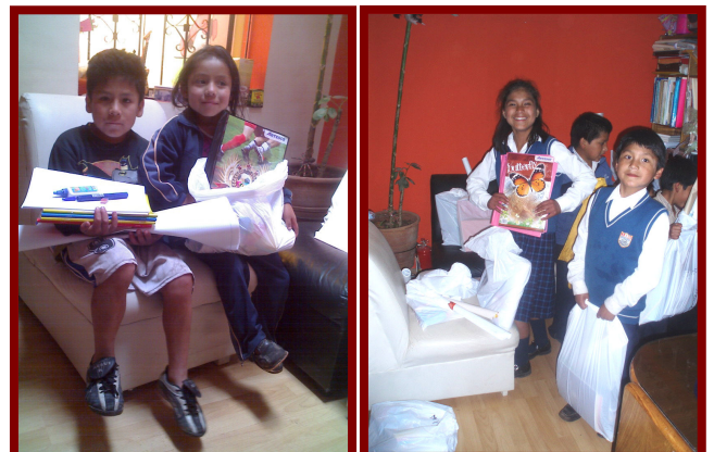
Met een stralend gezicht gepakt en gezakt weer naar school.

In maart zijn de scholen in Peru weer begonnen. Het is altijd prachtig om te horen en te zien hoe intens gelukkig de kinderen zijn, dat ze door de steun van Inti Huahuacuna naar school kunnen.