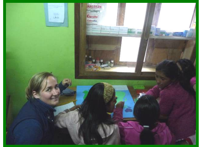
Spelenderwijs Engels leren.....

Naast mijn werkplan, waarvoor ik met de kinderen een spel heb gemaakt om hun Engels te oefenen, denk ik dat één van mijn mooiste ervaringen die ik met hen gedeeld heb het watergevecht is geweest. Dit gevecht heb ik georganiseerd naar aanleiding van Carnaval en was een groot succes bij de kinderen. Graag wil ik mijn aantekeningen van die dag met jullie delen.