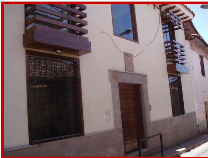
De trots van onze niños en het team van Inti Huahuacuna.