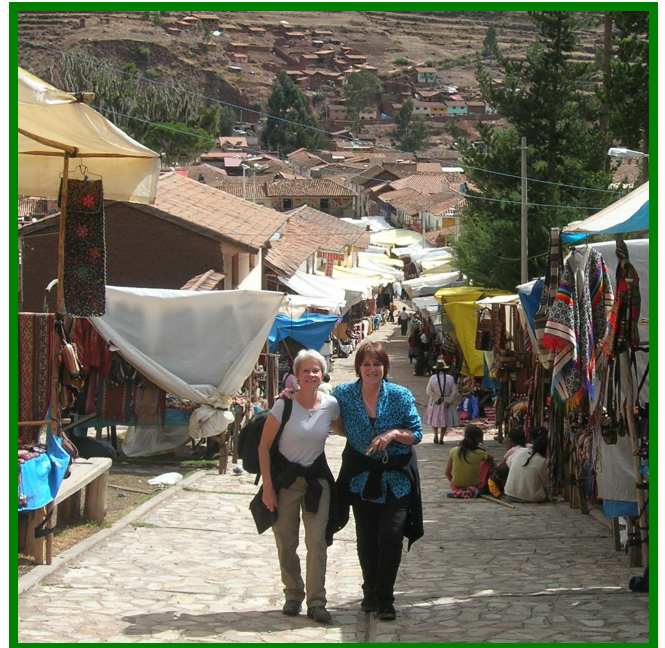
Samen in het weekeinde naar de markt in Pisac.

Ze beweegt zich daar als een vis in het water en windt iedere Peruaan om haar vingers, niet alleen door haar humor, maar vooral ook door het respect wat ze uitstraalt naar iedere Peruaan, groot en klein. Ze werkt keihard en ieder probleem wordt goed overdacht en enthousiast aangepakt en opgelost. Prachtig, wat een inzet!