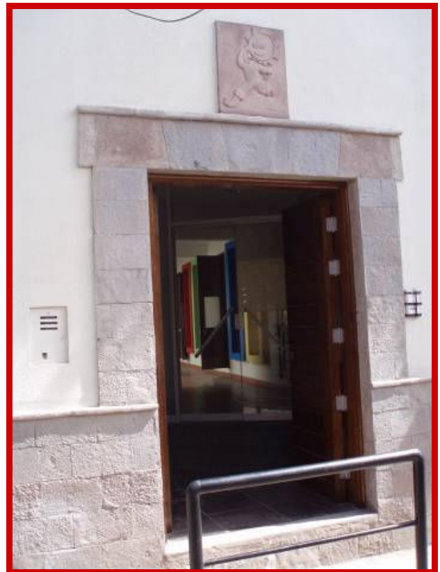
Enkele indrukken van de gevels.