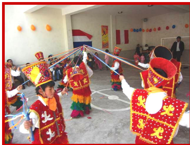
De niños doen een traditionele dans.