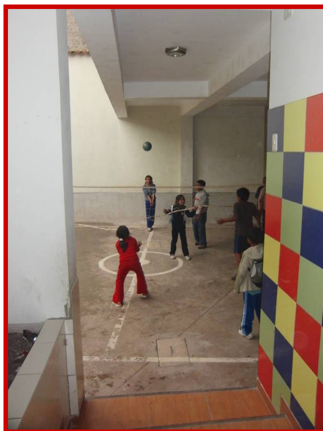
De grote droom van de niños: een sportveldje.