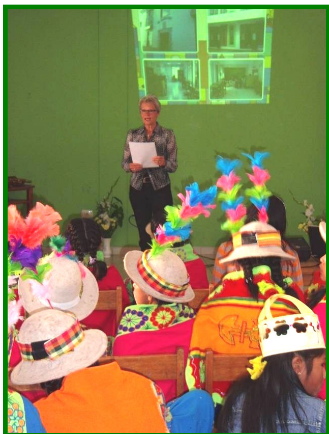
De opening van ons eigen opvanghuis.