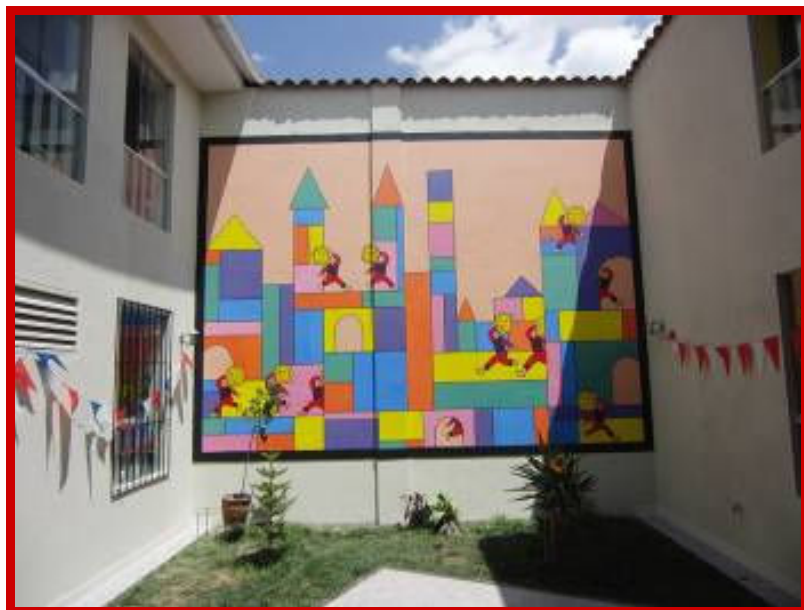
Onze vertrouwde muurschildering fleurt ook ons nieuwe huis op.