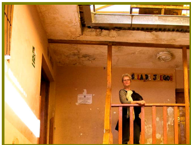
Het in verval geraakte wijkgebouw van Zarzuela.