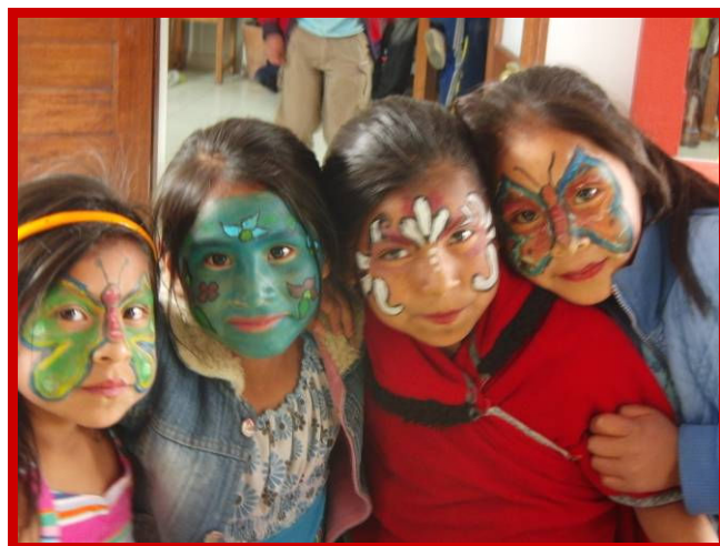
Vier mooie Halloween gezichtjes.