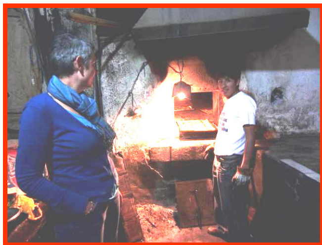
Nederlandse speculaasjes in een Peruaanse oven.

Als ik tegen Profe Flor vertel dat Dorris haar plan heeft veranderd en alleen de speculaasjes gaat bakken, zegt Flor dat dit een goed besluit is. De laatste keer dat zij dit werk samen met de kinderen heeft gedaan was het deeg na afloop zó zwart, dat ze de koekjes zelfs nog nauwelijks aan de kinderen durfde te serveren. Lachend zegt ze er achteraan dat ze blij is dat Dorris het alleen doet, aangezien ook het team een speculaasje krijgt. Als alle speculaasjes op de bakplaten liggen gaan we in een optocht, met de speculaasjes open en bloot op de bakplaten, door de regen en alle zwarte uitlaatgassen naar een openbare oven in de wijk om ze te bakken. We moeten lachen om onszelf als we er ons een voorstelling van maken dat we zo door Uden zouden lopen! In een donkere kamer, waar het vuur van de oven de hele dag brandt, worden in nog geen half uur al onze speculaasjes mooi bruin gebakken. Ik vind het ook symbolisch een heel mooie afsluiting van onze tijd met onze niños, want wat hoop ik dat wij de komende jaren ook het vuur van ons project zo goed brandend kunnen houden, waardoor er altijd ook een lekker Nederlands luchtje in ons Peruaanse opvanghuis zal hangen!