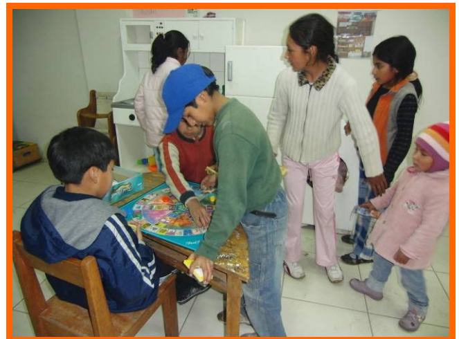
Samen spelen en genieten in het spelletjeslokaal.

voelen staan. Ik vind het altijd geweldig om te zien hoe creatief de kinderen zijn. Hieruit zie je dat arm zijn niet betekent dat je niets kunt, maar dat het vaak ook een stimulans kan zijn om je creativiteit te ontwikkelen. Als ik zo rond zit te kijken in het lokaal merk ik dat het me raakt te zien hoe intens ons huis leeft. Overal kom je spelende, hollende, lachende, roepende, en soms huilende, kinderen tegen. En bovenal zie ik hoe intens gelukkig het hen maakt om lekker even te mogen knuffelen. Je ziet de blik in hun oogjes veranderen en je voelt dat ze zich even helemaal ontspannen. Ook nu voel ik weer wat het toch weinig kost om een kind te laten voelen dat ook hij belangrijk en de moeite waard is. Dit is wat ik altijd voel bij al onze niños en als ik ooit voel dat oprecht geluk bestaat uit het gelukkig maken van anderen, dan is het hier.