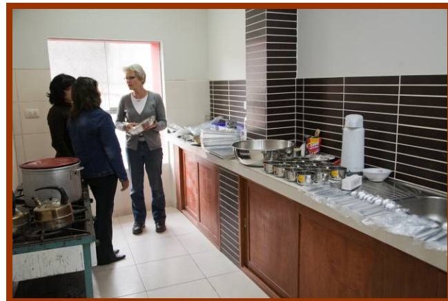
Het team bewondert de nieuwe keukenspullen.

bijna geen doen om in onze keukens te koken. Daarbij komen we bestek, borden, en koppen tekort, waardoor we lang niet alle kinderen tegelijkertijd eten kunnen geven.