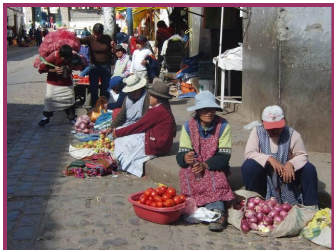
De straatverkopers van Cusco.

je licht in hun ogen komen. Alsof er een wereld voor hen opengaat.