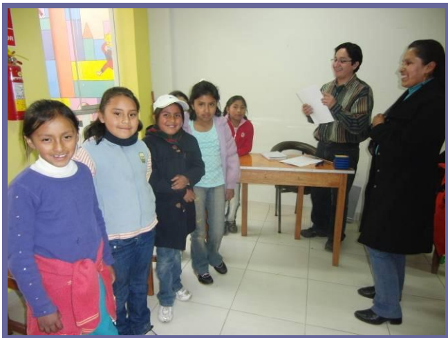
Zes nieuwe Inti Huahuacuna klantjes.

Inti Huahuacuna. Dit zijn echt dingen die mijn dag helemaal goed maken, want voor deze kinderen doen wij ons werk.