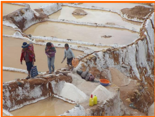
Werkende gezinnen in de zoutvlakte van Salineras.

Als ik zaterdag na het versturen van mijn weekverslag de stad in ga, duurt het niet lang of de regen valt er met bakken uit. Het is koud en nat, en als het hier eenmaal regent houdt het voorlopig nog niet op. Als ik 's avonds nog steeds regent als ik naar huis ga, besluit ik om niet al mijn vrije dagen in Cusco door te brengen. Ik moet nog terug naar mijn schaakmannetje in Pisac en besluit daar een reisje naar Urubamba aan vast te plakken. In de hoop dat in de Heilige Vallei de zon een beetje voor me zal schijnen. Ik heb me voorgenomen om vanuit Urubamba naar de zoutmijnen van Salineras te gaan wandelen.