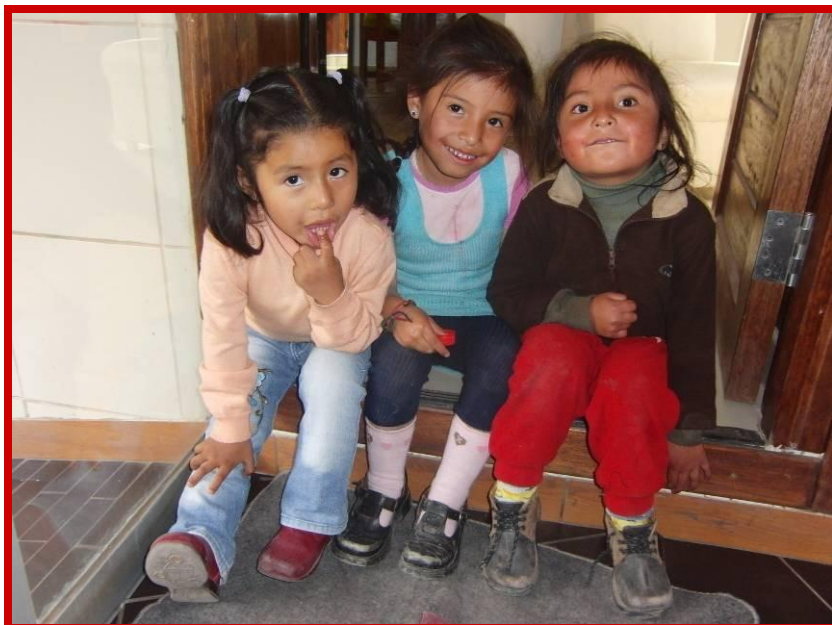
Enthousiaste klantjes van Inti Huahuacuna.