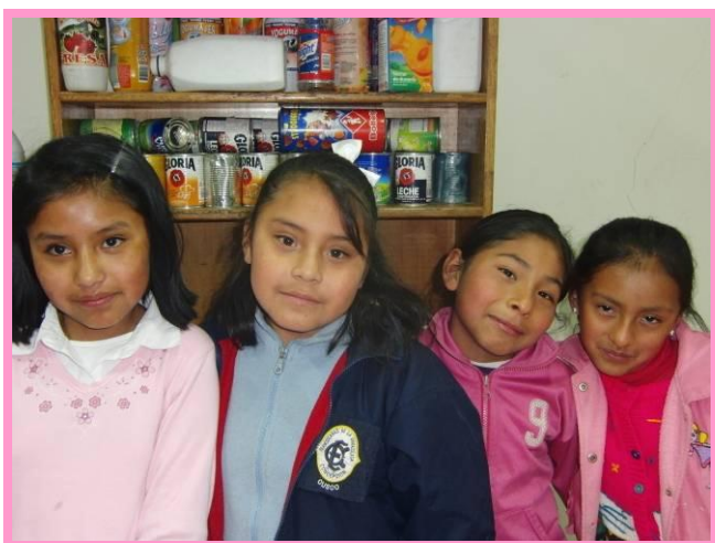
De nieuwe kinderen genieten in het spelletjeslokaal.

Wat doet het me goed als ik maandagochtend zie dat het hele groepje kinderen, dat vorige week ons opvanghuis bezocht heeft, naar Inti Huahuacuna is gekomen. Dit zijn allemaal kinderen die door hun ouders in de steek zijn gelaten, en die afhankelijk zijn van oudere broers of zussen, of van een familielid. Bloedserius zitten ze in de bibliotheek hun huiswerk te maken, om zich daarna lekker te gaan uitleven in het knutsellokaal of in het spelletjeslokaal. Dit zijn voor mij echt de mooiste momenten van mijn werk hier, te weten dat we deze kinderen veiligheid kunnen bieden en dat we hen een beetje op weg kunnen helpen in deze voor hen zo moeilijke wereld.