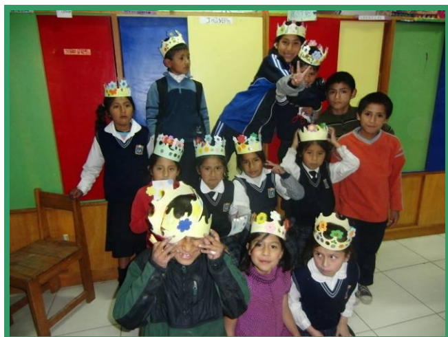
De opvang bij Inti Huahuacuna voelt als een feest.

Op maandag is het dan eindelijk zover en ga ik onze niños weer ontmoeten. Wat is het weer heerlijk om ons huis binnen te komen. De spontane omhelzingen en de vrolijke lach van onze kinderen maakt me altijd ontzettend gelukkig, geven me het gevoel weer thuis te komen.