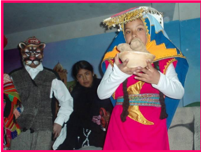
Een meisje heeft de rol van 'Moeder Aarde'.

de maatschappij ook zij de moeite waard zijn, en dat ook zij gehoord en gezien mogen worden.