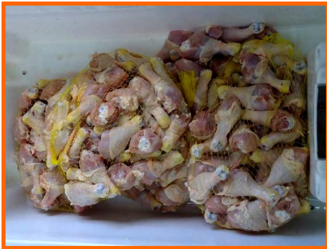
Van de 170 Kerstkippenpootjes waren er 3 over.