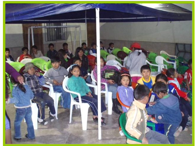
De niños wachten vol spanning op het toneelstuk.

Inti Huahuacuna verzorgt jaarlijks op de pleinen in Cusco straattoneel en tevens geven we presentaties over ons werk met de niños. Hierdoor kunnen andere kansarme wijk- en straatkinderen en hun ouders kennis maken met het werk van de stichting. Tevens verzorgt Inti Huahuacuna exposities op straat, waar de werkstukken van de kinderen worden tentoongesteld. We kwamen op het idee om voor het theater een tent, achtergrondpanelen, stoeltjes en een muziekinstallatie aan te schaffen.