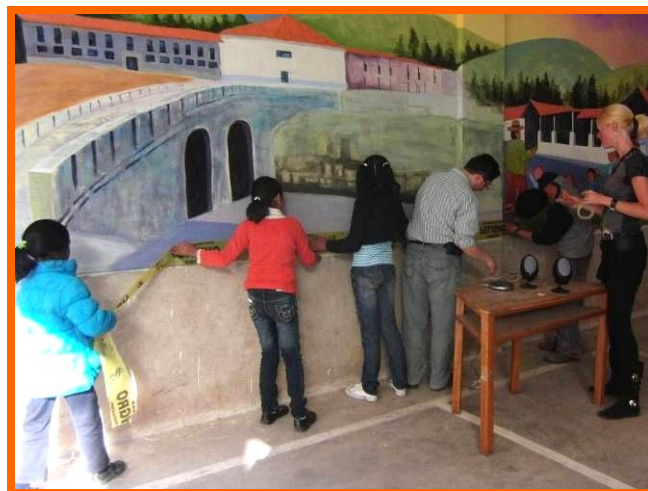
Muurschildering levensverhaal van Inti Huahuacuna.

situatie had. Ik heb geleerd dat ik soms dingen moet laten gebeuren zoals ze gebeuren, en zelfs af en toe moet meewerken op een manier zoals ik zelf nooit gedaan zou hebben. Hiermee kon ik meer bereiken, dan wanneer ik de situatie op mijn eigen manier had aangepakt.