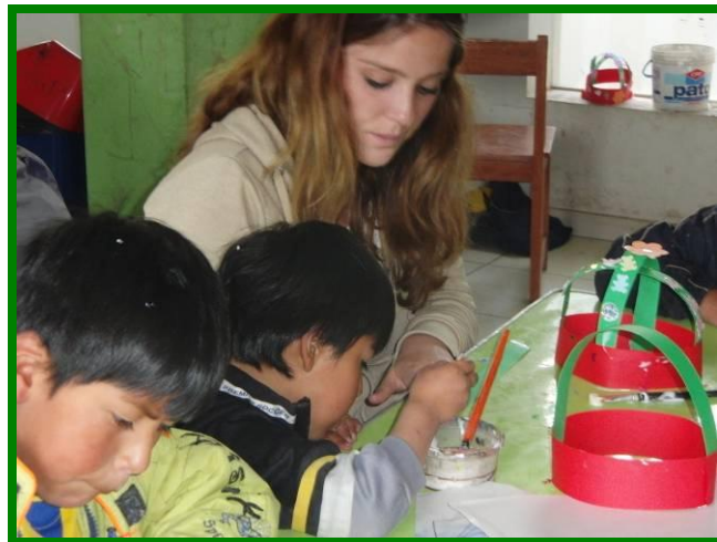
De hulp van vrijwilligers is voor de niños altijd een feest.

en na een lange zoektocht hadden we er een gevonden. Bij het installeren van de beamer kwamen stiekem af en toe wat kinderen binnen geslopen om te kijken wat er allemaal gaande was. Zoiets hadden ze nog nooit gezien, en als we ze weer vriendelijk verzochten naar de gang te gaan, hoorde ik enthousiaste kreten als: 'Bioscoop! Bioscoop!'