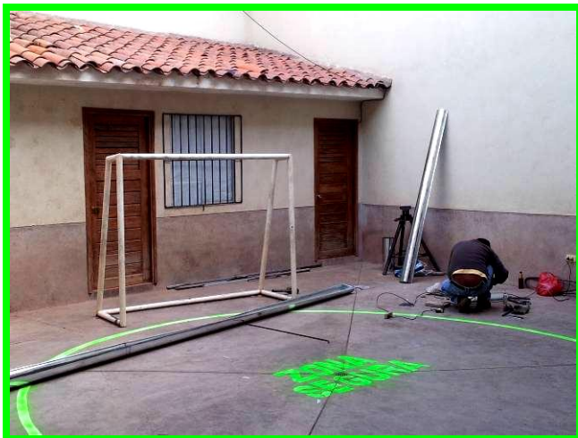
Op het sportveldje is een veiligheidszone aangebracht.

Bij aanvang van ons werk in het buurthuis van Zarzuela moesten we bij de Gemeente een vergunning aanvragen om een project met kansarme kinderen te mogen runnen. Wij dachten deze vergunning automatisch mee te nemen naar ons nieuwe huis in Almudena, maar niets is minder waar. Bijna een jaar geleden klopte de Gemeente bij ons aan en kregen we te horen dat we deze hele procedure opnieuw moesten opstarten. Wat een tegenvaller! Al bijna een jaar zijn we hier mee bezig en het is een helse klus. Niemand kan je vertellen wat je hiervoor allemaal precies moet doen, en steeds als we blij zijn een stap gezet te hebben komt men weer met nieuwe eisen aanzetten. Na alle aanvragen bij de Gemeente te hebben ingevuld, en alle documenten te hebben ingediend, moesten we contact opnemen met een volgende instantie, het Indeci.