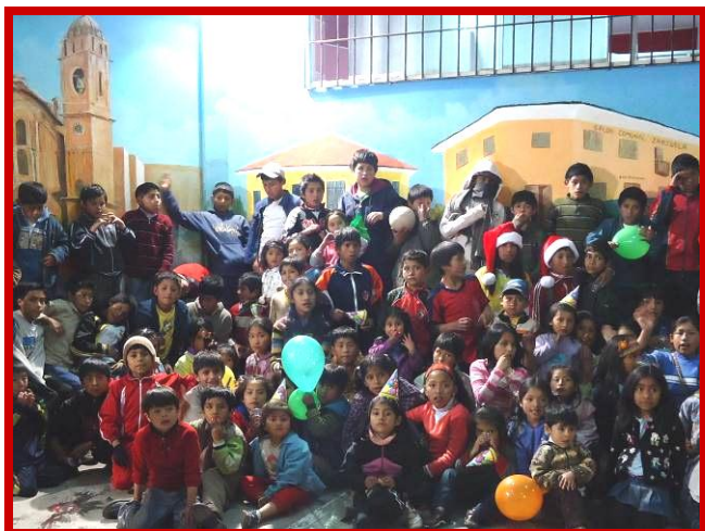
Groepsfoto van de niños na het Kerstdiner.

thuis niet veel te eten krijgen. Iedereen roept, schreeuwt: "Ik heb minder kip, mijn aardappel is kleiner", maar uiteindelijk zit iedereen met een volle mond en een bordje op schoot te genieten van het kerstdiner.