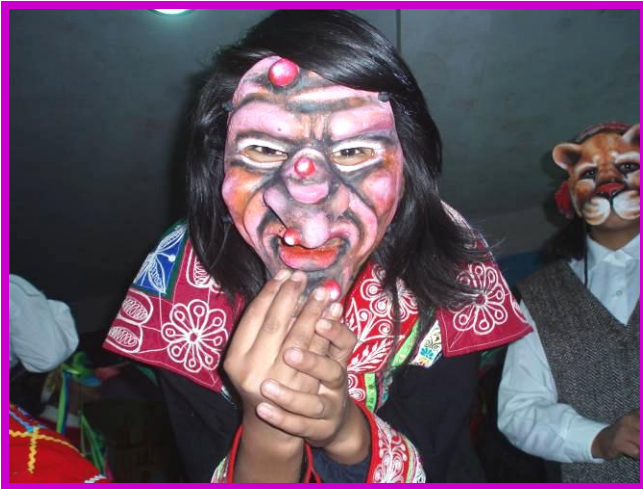
Achique, de heks van de Andes.

om niet meer bang te zijn. Door te zien dat het me lukte was ik niet meer nerveus en gespannen.