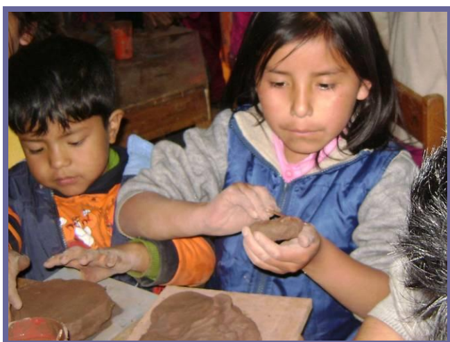
Uit donaties kregen de kinderen ook keramieklessen.

Een kind deed haar presentatie over abortus. Ze had weinig tekst bij haar dia's en ik legde haar uit dat ze dus zelf meer zou moeten uitleggen bij haar presentatie. Maar dit kind pakte het heel slim aan. Om tijd te rekken liet ze haar dia's heel langzaam voorbij komen en toen zij bij de problemen van abortus kwam had ze een einde aan haar presentatie zonder tekst erbij. Maar heel zelfverzekerd pakte ze de microfoon en zei: "dit is gevaarlijk, want dit is slecht voor je gezondheid, de moeder zou wel eens nooit meer zwanger kunnen worden en ze zou dood kunnen gaan door bloedingen, infecties.....héél gevaarlijk"!! Ik moest moeite doen om mijn lach in te houden, bij het zien van haar ernstige gezichtje en de wijze waarop ze dit zei.