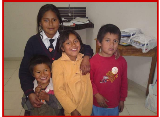
Ook deze kinderen kunnen gelukkig weer naar school.

livia. De laatste studies over Zuid-Amerika zeggen dat de meeste leerlingen, die een basisschool van de Staat hebben doorlopen, maar weinig hebben opgestoken op onderwijsgebied. Ondanks dat de wereldkampioen Wiskunde uit Peru komt, bereikt het grootste gedeelte van de leerlingen niet het landelijke niveau wat taal en wiskunde betreft. Hierbij zou ook de slechte voeding, het niveau van het onderwijzend personeel, gezondheidsproblemen, infrastructuur en het ontbreken van educatief materiaal een rol kunnen spelen.