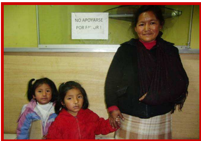
Candy met haar moeder.

Hierdoor is Candy beter gaan praten en haar moeder straalt als ze dit vertelt. We wisten dat Candy geopereerd zou worden en daarom zijn we haar afgelopen vrijdag thuis gaan opzoeken. Het verbaasde mij dat ze thuis veel geslotener is dan bij Inti Huahuacuna. Toen haar vader binnenkwam was het me snel duidelijk waarom de moeder en Candy zo benepen zaten te kijken. Haar moeder is een vriendelijke vrouw, maar de vader weigerde ons een hand te geven, negeerde ons totaal, en keek zijn vrouw en dochtertje met een ijskoude arrogante blik aan.