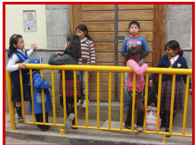
De kinderen staan te popelen om naar binnen te mogen.