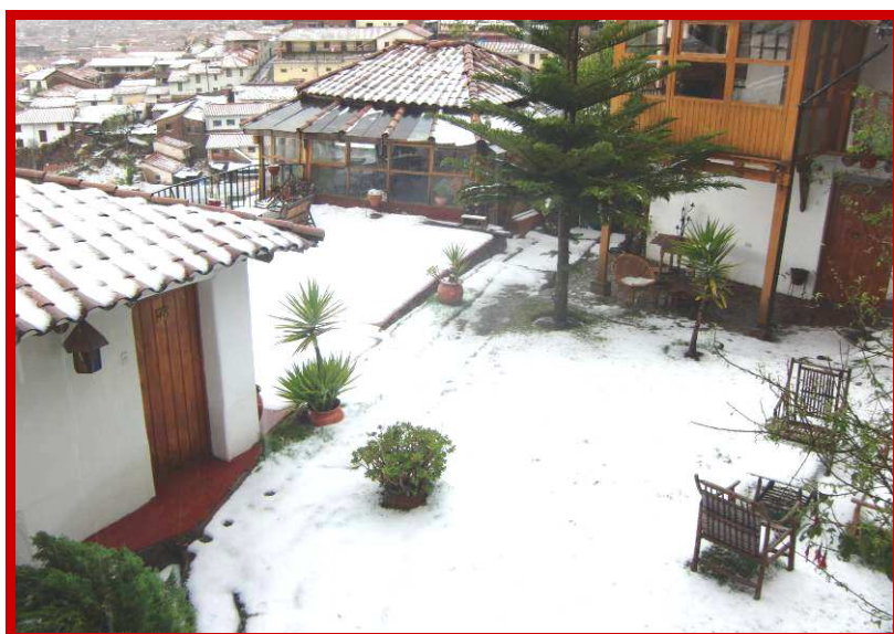
Een prachtig, maar koud, Cusco.