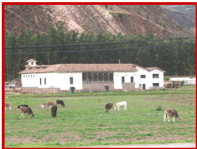
De school van de missionarissen in Andahuaylillas.

's Avonds in bed lig ik nog aan deze kinderen te denken en aan mijn moto: "Doe wat je kunt, met wat je hebt, waar je bent".