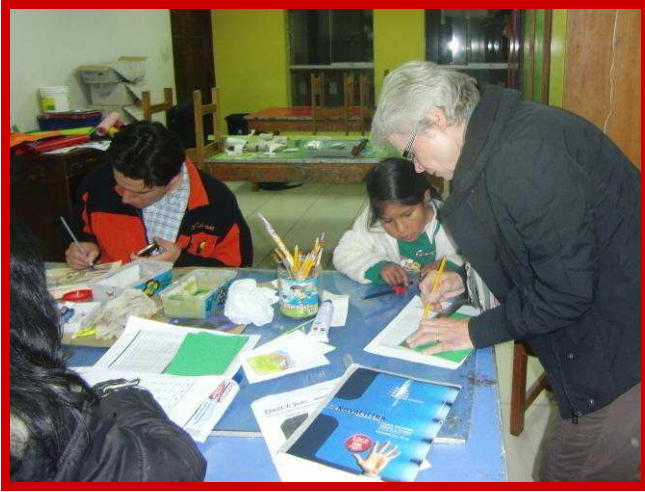
Gezellig werken in het knutsellokaal.