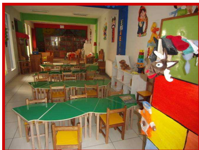
Een eigen kleuterschool, een droom wordt werkelijkheid.

Al jaren is het de grote droom van Dolores en het Peruaanse team om een kleuterschool te kunnen starten, want we hebben hiervoor de ruimte in ons eigen opvanghuis.