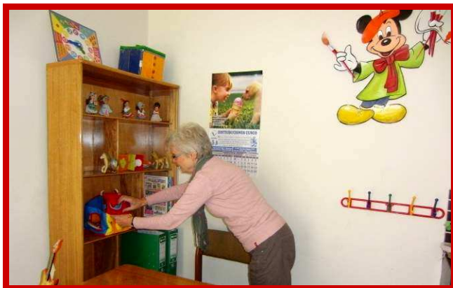
Het inrichten van de kleuterklassen; heerlijk om te doen.

Als de inspecteur woord houdt dan hebben we over ongeveer een maand de volledige goedkeuring voor de kleuterschool, want dit was de laatste inspectie die nog gedaan moest worden. Het feit dat deze man eindelijk is gekomen, is al een pak van ons hart. We zien de toekomst nog steeds vol optimisme tegemoet en strijden lustig voort.