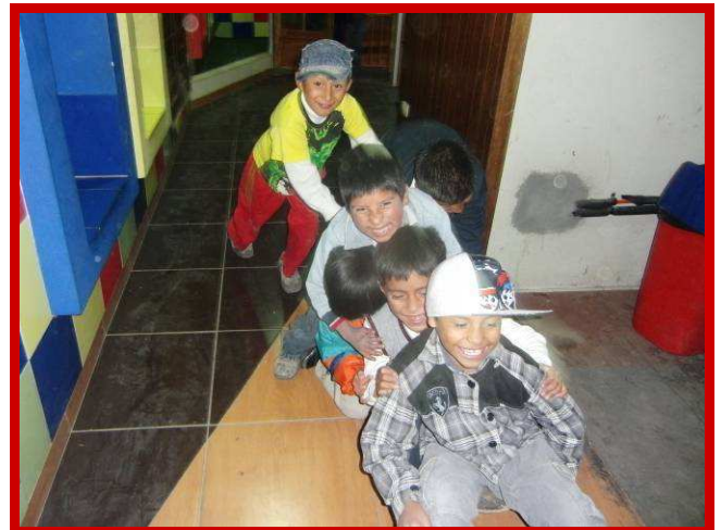
De kinderen leven zich uit en hebben de grootste lol.