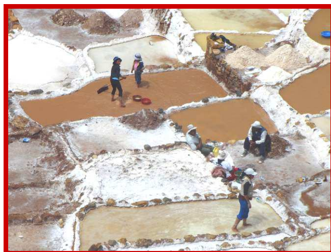
Het zware werk in de zoutmijnen van Las Salineras.