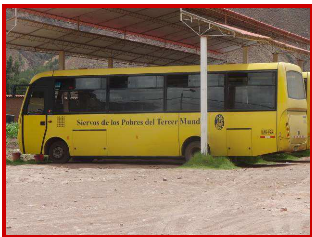
Dagelijks worden de leerlingen met de bus opgehaald.