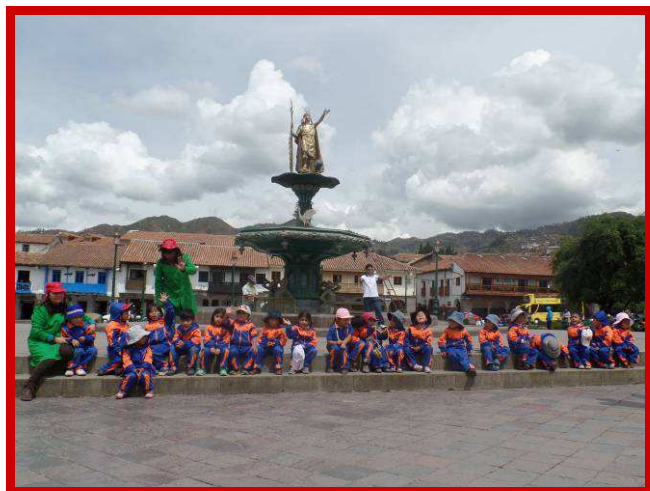
De kleutertjes in uniform op het Plaza de Armas.

gemaakt. Deze eerste kennismaking met een kleuterschool zal voor de kinderen een grote steun zijn om hierna de stap te kunnen zetten naar de basisschool. Ik denk en ik voel dat deze nieuwe stap van Inti Huahuacuna zijn weg zal gaan vervolgen.