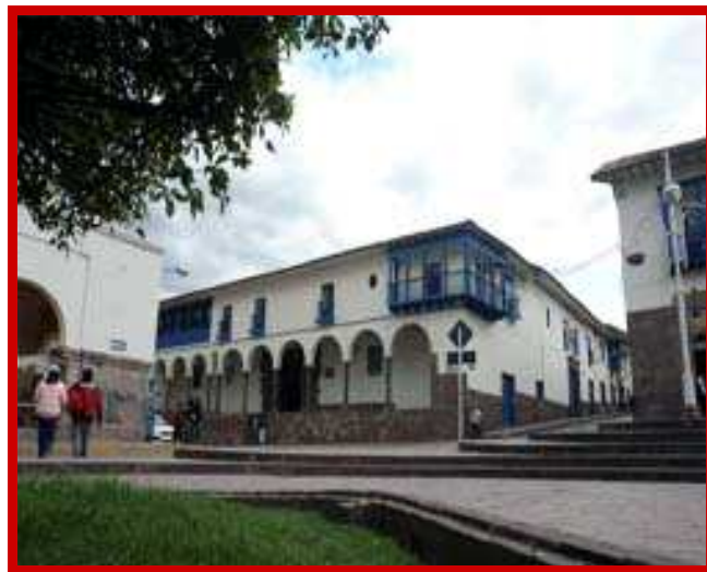
Museum Regional de Casa Garcilaso de la Vega.

Volgens de geschiedenis is in dit huis de beroemde Inca-schrijver Garcilaso de la Vega geboren. Hij is nu dood en ligt in de kathedraal van Cusco begraven.