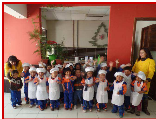
De kokjes bakten een taart ter ere van de opening.

Eind februari krijgen we de goedkeuring. Inmiddels hebben we ook een directrice, een kleuterleidster en een klassenassistente gevonden. En dan komt de grote dag. Niets staat ons nog in de weg om op 14 maart 2014 de deuren van onze kleuterschool officieel te openen. Een kleuterschool volgens de filosofie van Inti Huahuacuna: een volledige beurs voor de minderbedeelde kinderen van Cusco en een kleine betaling door de ouders die dit kunnen.