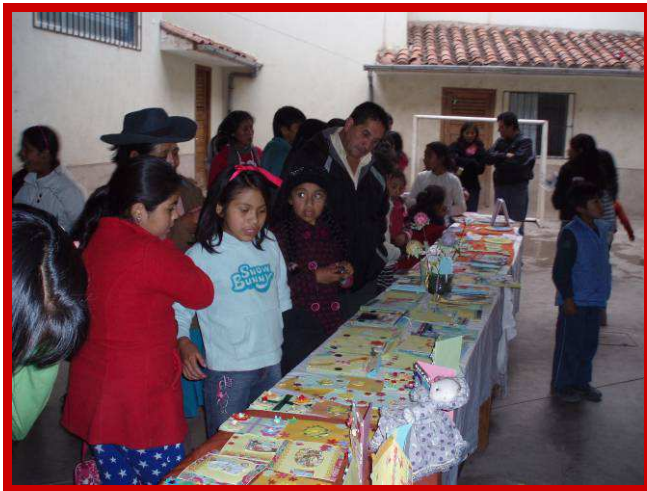
Een warme belangstelling voor het werk van de niños.

alle kinderen en de profe's te picknicken. Ik vond het heel jammer, en was een beetje triest, toen deze dag voorbij was. Maar we gingen allemaal met de bus terug naar de stad en dat was weer heel gezellig.