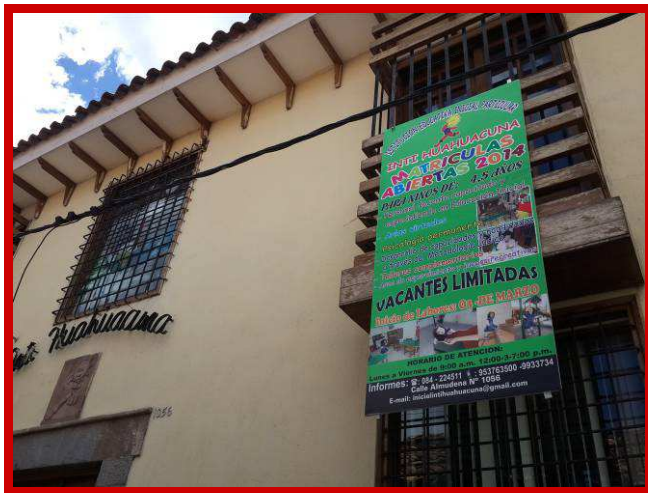
Affiche voor aanmelding kleuters Inti Huahuacuna.

Naar aanleiding van dit onderzoek werd, door verschillende lokale en regionale instituten, de Red de Educación Comunitaria opgericht. Vanuit dit netwerk hopen wij het voor elkaar te krijgen dat alle lessen, die buiten het normale schoolonderwijs worden geboden zoals bij instituten als Inti Huahuacuna, door de regering officieel erkend zullen worden.