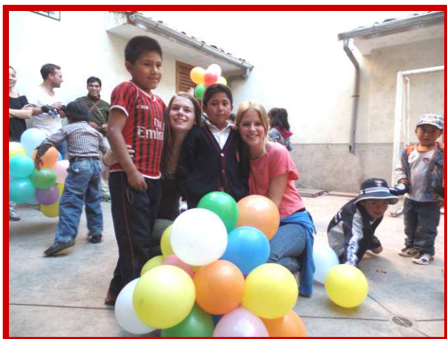
Peruaanse gezelligheid met Nederlandse ballonnen.

De kinderen werden steeds spontaner en kwamen naar ons toe om ons een knuffel te geven of een heel verhaal te vertellen in het Spaans. Helaas, was ons Spaans niet goed genoeg om alles te verstaan, maar toch konden we er samen met de kinderen uit komen door ze het te laten uitbeelden of te laten aanwijzen. Toen we onze fotocamera tevoorschijn haalden, wilden alle kinderen even met ons op de foto en ook wilden ze zelf graag foto's maken.