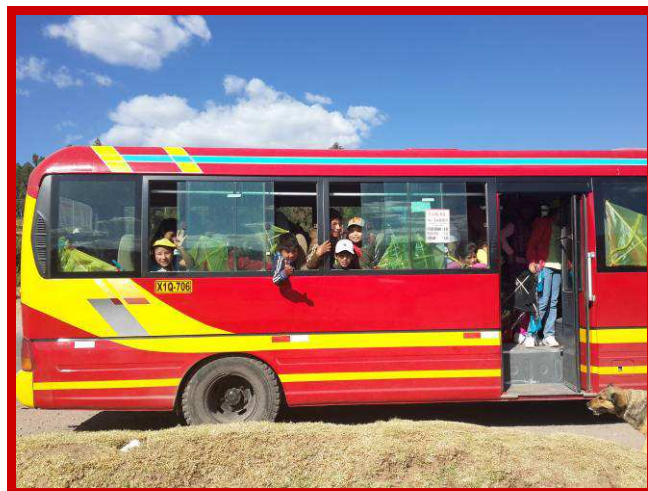
Een volle bus kinderen op weg naar de vliegerwedstrijd.