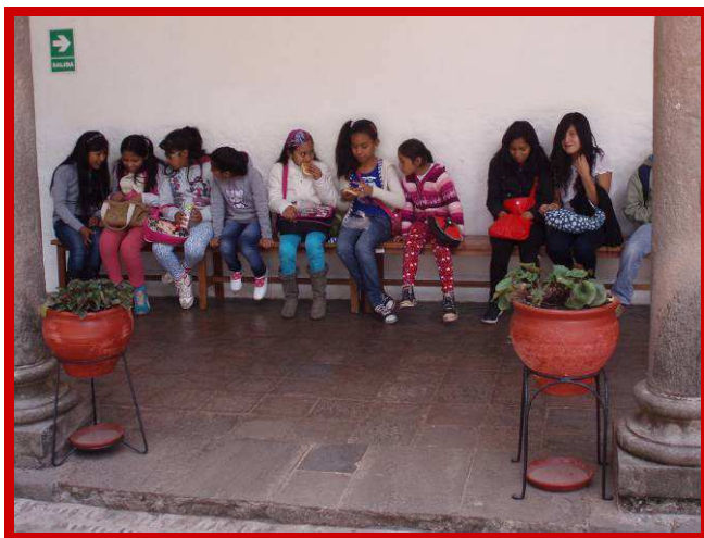
Een cultureel uitstapje naar het museum.

Mario Vargas Llosa heeft geschreven: "Musea zijn net zo belangrijk voor landen als scholen en ziekenhuisen. Zij leren ons iets en genezen ook, geen lichamen, maar de geest. Musea..... zij vervolmaken de gevoeligheid, stimuleren de verbeelding, verfijnen de gevoelens en doen in mensen een kritische geest en zelfkritiek ontwaken.