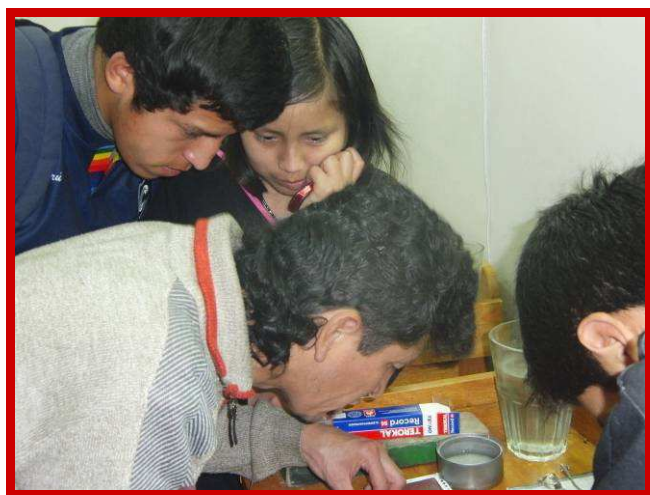
Aandachtig volgen de zilversmidjes in spe de les.

Ik ben al aan mijn 2 o studiejaar begonnen en het verheugt me dat ik zo goed vooruit ga. Elke dag ga ik met heel veel plezier en enthousiasme naar het Opleidingsinstituut Khipu.