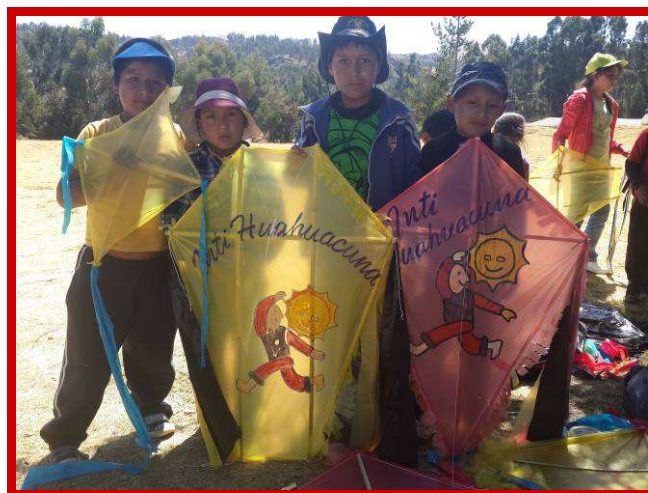
De zon schijnt vandaag voor de 'Kinderen van de zon'.

Iedereen had een mooie vlieger gemaakt en toen vertelden de profe's ons dat we allemaal een dag met de bus naar Sacsayhuamán zouden gaan, om onze vliegers op te laten. Voor mij was dit een heel spannende en emotionele dag.