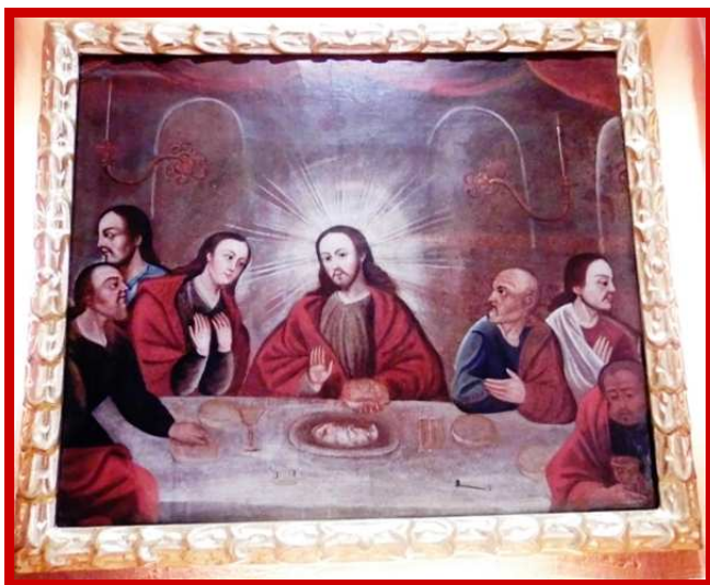
Het laatste Peruaanse avondmaal, inclusief cavia.

Vooruitgang maken betekent niet alleen veel scholen, ziekenhuizen of wegen bouwen. Ook, en misschien wel vooral, brengt vooruitgang ons de wijsheid om het lelijke van het mooie te onderscheiden, het intelligente van het domme, het goede van het kwade en tolerantie van niet tolerant zijn. Dit noemen we cultuur".