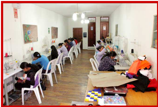
Grote bedrijvigheid in het naaiatelier.

Feliz Navidad y Próspero Año Nuevo, Edelmira.