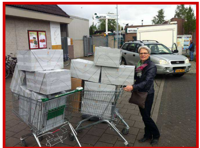
Wat zullen de niños weer genieten van deze materialen!