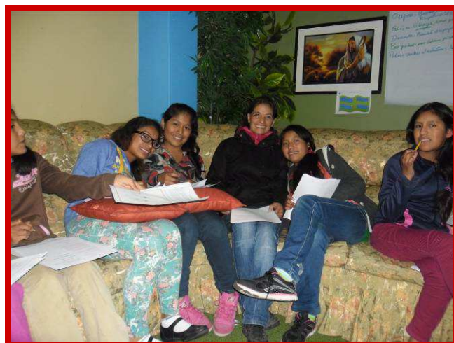
Flor en de meisjes van Restoring Children.

hun eigen kinderen door hen dit voor te leven, zodat deze kinderen het goede voorbeeld van hun ouders gaan volgen en in hun voetsporen verder leven.