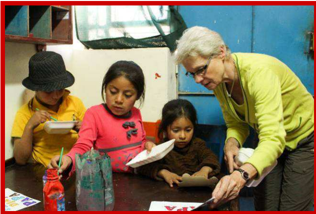
Samen met de kinderen bouwen aan een betere toekomst.

Het einde van het jaar is in zicht en dat is altijd een mooi moment om terug te kijken op het afgelopen jaar. Allereerst wil ik jullie allen intens bedanken voor jullie jarenlange trouwe steun, waardoor wij nu ook vele kansarme kinderen in Arequipa en Ayacucho kansrijker kunnen maken. Vooral de maandelijkse vaste overschrijvingen van donateurs, en de donaties van donateurs die zich d.m.v. een schenkingsakte voor 5 jaren aan ons verbonden hebben, zijn een grote steun voor ons, want hiermee bieden jullie ons een stevig houvast.