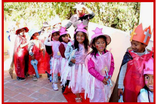
De kinderen en het team wensen u een Zalig Kerstfeest.

Op de drempel van het Nieuwe Jaar dank ik jullie uit de grond van mijn hart voor het in ons gestelde vertrouwen en wij hopen met jullie steun ook in het nieuwe jaar weer veel kansarme kinderen kansrijker te maken.