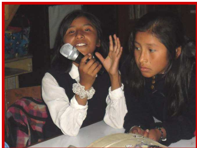
Iedereen mag haar horen, want ook zij is belangrijk!

reageer niet altijd zoals het zou moeten. Ik wil gaan leren om eerst datgene te doen dat belangrijk is voor mijn toekomst.