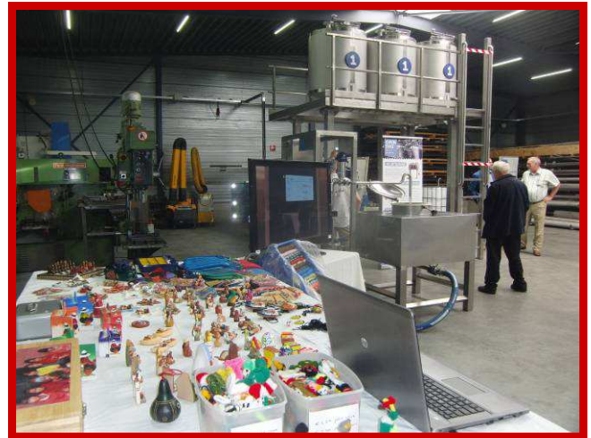
Open dag bij D&W tijdens het 15-jarig jubileum.