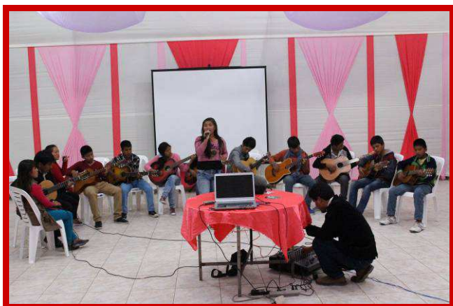
Eerste officiële optreden van onze muzikanten.