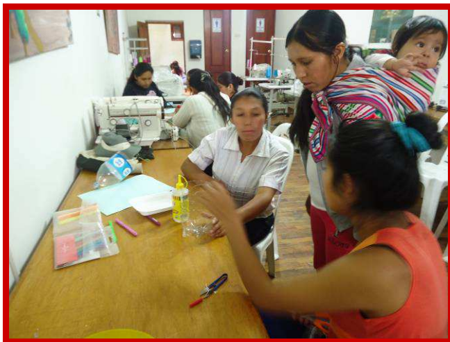
Groot overleg in het naaiatelier.