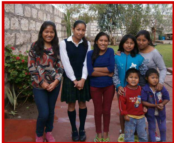
Enkele meisjes van het opvanghuis Restoring Children.

kosten die bij de opvang van zoveel kinderen komt kijken. En dan heb ik het niet alleen over de materiële opvang van deze kinderen maar vooral over de psychische opvang, om hen in deze donkere tijd in hun leven te laten zien dat ook zij een kans hebben in dit leven; dat ook zij de mogelijkheid hebben hun leven te veranderen; en dat zij de zware last uit hun verleden, die ze met zich meedragen, kunnen achterlaten. Onze workshops zijn dan ook het begin van een nieuw leven voor hen.