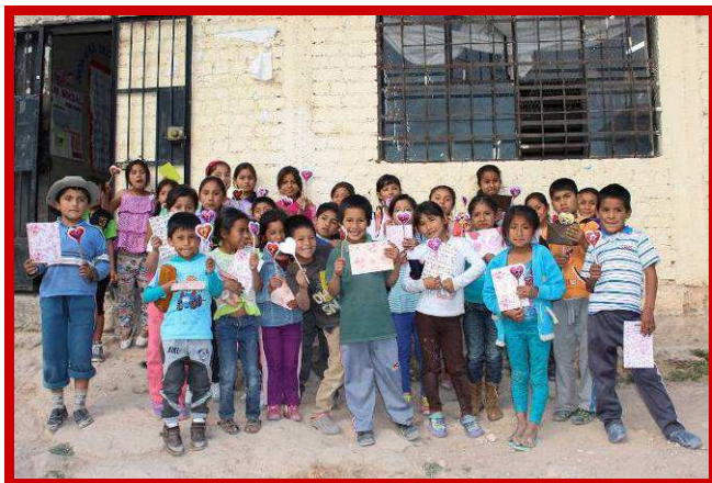
Een 'hart'elijke groet van alle kinderen.

Tijdens het vertalen van de persoonlijke verhalen van de kinderen en de tienermoedertjes raakten me de openheid en eerlijkheid waarmee ze hun worsteling, om hun weg in dit leven te vinden, met ons delen. Hierbij realiseer ik me eens te meer hoeveel invloed, de plek waar je kribje staat, heeft op het leven van een mens.