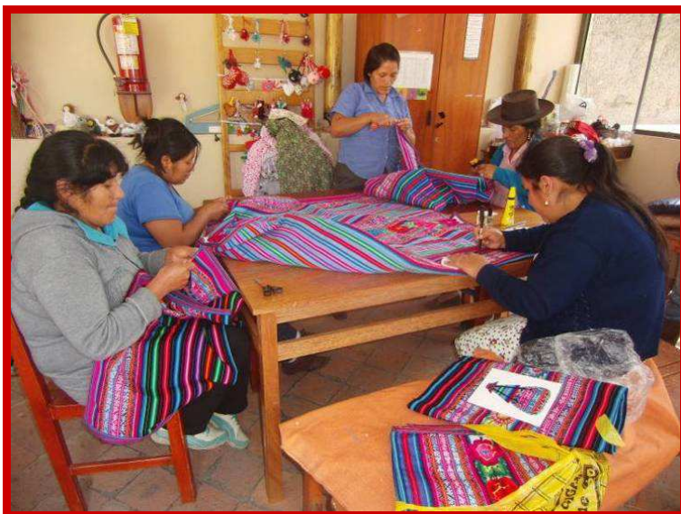
Een nieuwe uitdaging voor de mamitas, kerstkaarten maken.