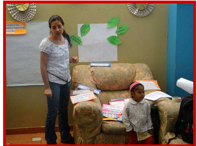
De meisjes vullen de levensboom met bladeren.

hun best doen om mee te denken en antwoord op onze vragen te geven. We hebben een levensboom getekend en alle meisjes hebben een papier boomblad gekregen waarop zij moeten verwoorden wat volgens hen vriendschap is. Er komen mooie woorden uit, zoals: vriendschap is respect hebben voor elkaar, blind vertrouwen, delen, naar elkaar luisteren, er voor elkaar zijn in goede en slechte dagen, begrip, liefde en communiceren met elkaar.