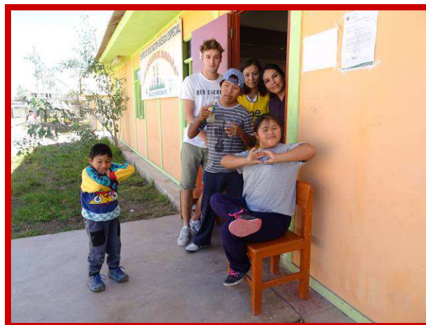
Een warm afscheid van onze Peruaanse "Jostiband".