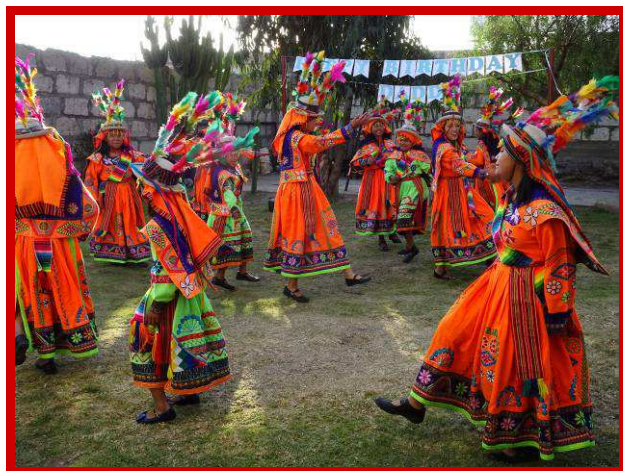
De meisjes voeren een feestelijke traditionele dans op.