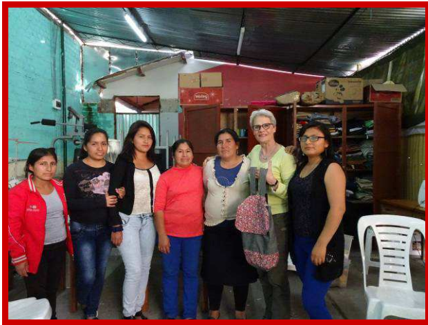
Ik ga op reis en ik neem mee.....

Gebruik je verleden niet als hangmat, maar als springplank.