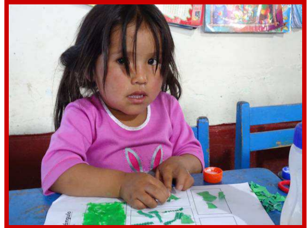
Jong geleerd is oud gedaan.

tie. Maar belangrijker is het om een strategie te ontwikkelen om dit te realiseren.