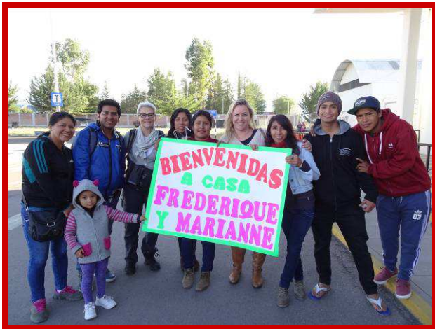
Een warm welkom in Ayacucho.