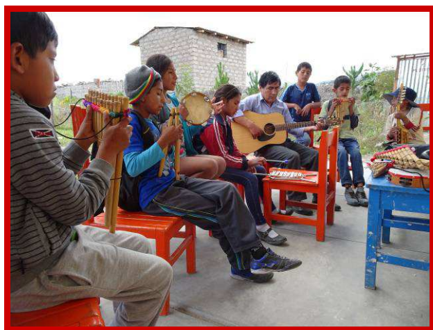
De jongeren genieten van hun muzieklessen.