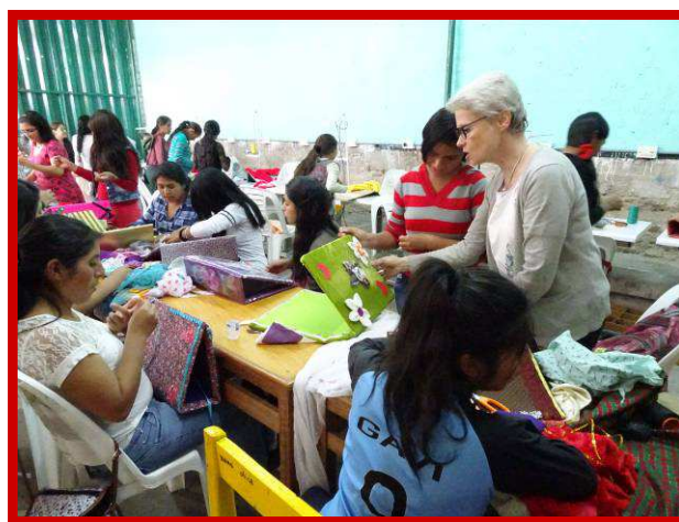
Een nieuwe naaiopleiding vol enthousiaste leerlingen.