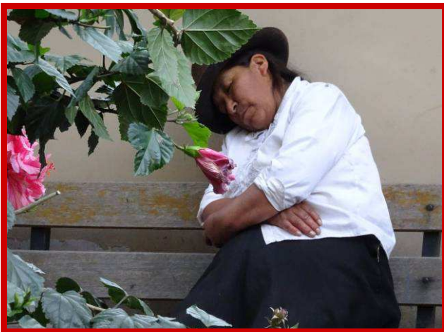
Na gedane arbeid is het goed rusten.