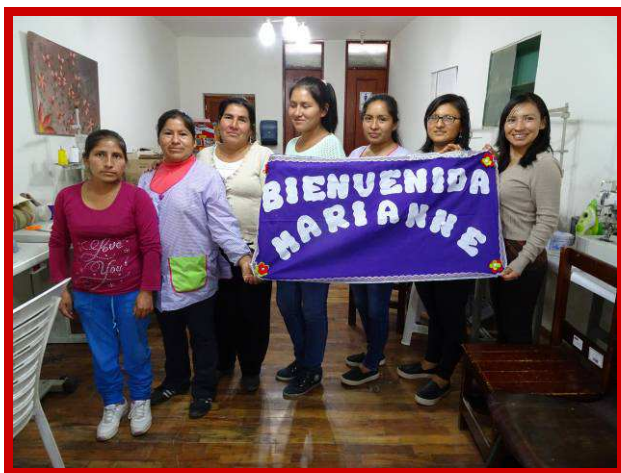
En warm welkom van de leerlingen van de naaiopleiding.