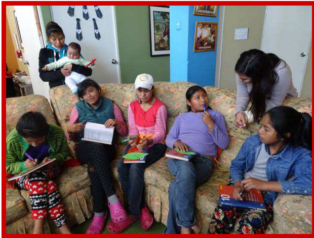
Een workshop over vriendschap aan Restoring Children.

van hun huiswerk afhankelijk te zijn van de steun van een opvanghuis als Hogar de Cristo, omdat hun ouders hen niet kunnen helpen. Misschien is dat de reden dat ze zo hard roepen, om ook gehoord en gezien te worden. Een ding is zeker, ook hier is nog veel werk te verzetten.