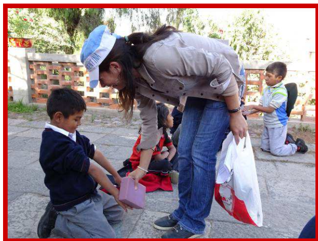
Hoe voelt een spons?

Deze ronde gaan we het hebben over gevoelens. Maar eerst willen we graag weten wat hun ouders hebben geantwoord op de vraag hoe zij hun lichaam kunnen beschermen. Een van de kinderen antwoordt met een stralend gezicht dat hij zich warm moet aankleden, maar de rest kijkt ons beteuterd aan. Ze hebben blijkbaar de vraag meerdere malen aan hun ouders gesteld, maar die antwoordden hen dat ze voor zulk soort dingen geen tijd hebben. Met alle wilde verhalen die de kinderen over het nachtleven van hun ouders vertellen kan ik me dit goed voorstellen! We besluiten dat we onze vraag op een briefje mee gaan geven en ook de profesora belooft dat ze de kinderen er dagelijks aan zal herinneren.