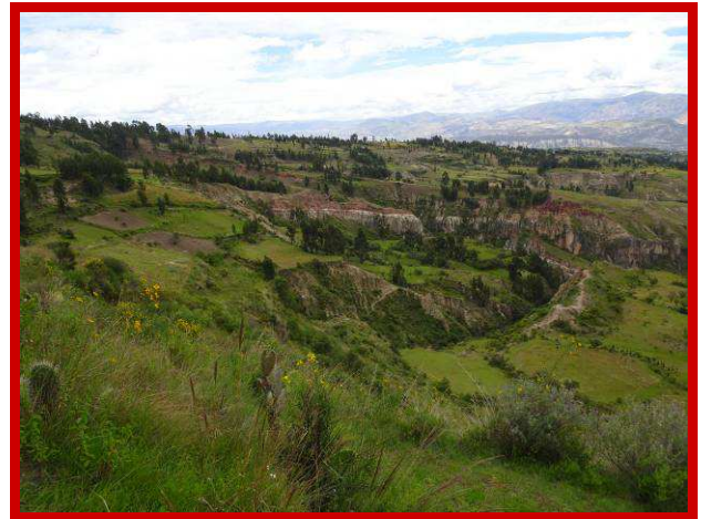
Een stukje paradijs in Quinua.

Frédérique en ik besluiten om meteen de eerste zondagochtend naar Quinua te reizen om daar een stuk grond te gaan bekijken.