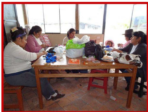
De mamitas kunnen praten en breien tegelijk.