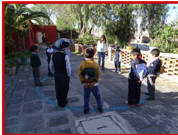
Het is heerlijk om ook buiten te werken met de niños.

vooral dynamische lessen moeten zijn, waar de kinderen actief bij betrokken worden.