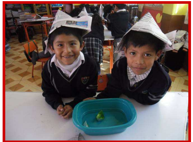
Deze twee jongens zijn kapitein op hun eigen levensschip.