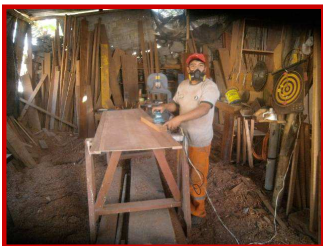
Een mooie klus voor de timmermannen.

Het is prachtig dat we de leerlingen, die bij ons de vakopleiding metaalbewerken volgen, stalen balken konden laten maken om de grote voordeur te beveiligen tegen inbraak.