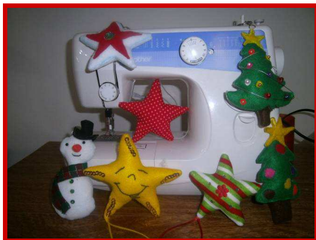
Een Kerstgroet van de leerlingen van de naaiopleiding.

Tijdens het vertalen van de persoonlijke verhalen van de kinderen en de tienermoedertjes raakten me de openheid en eerlijkheid waarmee ze hun worsteling, om hun weg in dit leven te vinden, met ons delen. Hierbij realiseer ik me eens te meer hoeveel invloed de plek waar je kribje staat heeft op het leven van een mens.