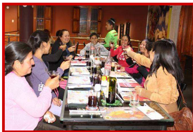
Een toast op een zelfstandige toekomst.

Dit jaar zijn we tijdens mijn werkverblijf in Ayacucho een nieuwe naaiopleiding met een tweede groep leerlingen gestart. Wat zijn de tienermoedertjes, die vorig jaar aan hun opleiding zijn begonnen, er trots op dat wij hen de mogelijkheid bieden om op toerbeurt ervaring op te doen als assistente van de naailerares bij deze nieuwe groep! Hiervoor krijgen zij een kleine betaling, waardoor zij na het afronden van hun studie een eigen naaimachine kunnen kopen om een naaiatelier te starten. Onlangs zijn de leerlingen van groep 1 afgestudeerd. Voor hun examen moesten zij een examenopdracht uitvoeren, waarin ze alles moesten laten zien wat ze tijdens het afgelopen jaar geleerd en gemaakt hebben. De leerlingen werden beoordeeld op hun technische kennis, creativiteit en persoonlijke ontwikkeling. De moedertjes waren zeer geëmotioneerd, zagen er gelukkig uit en zijn trots op hun behaalde triomf en het eerste diploma in hun leven!