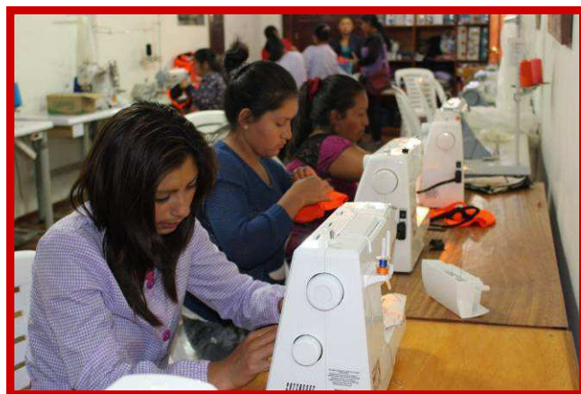
De aanhouder wint!

Onlangs heeft de eerste groep alleenstaande- en tienermoedertjes de naaiopleiding afgerond. Een jaar lang hebben zij ervoor geknokt om dit felbegeerde diploma te halen. Toen we in 2015 deze vakopleiding startten waren de moeders verlegen, onzeker en hadden totaal geen eigenwaarde en zelfvertrouwen. Als ik hen dit jaar met een stralend gezicht, vol zelfvertrouwen, zie staan, kan ik nauwelijks geloven dat dit dezelfde moeders zijn. Vol trots vertellen ze over de vorderingen die ze het afgelopen jaar hebben gemaakt en laten hun zelfgemaakte schorten en producten zien.