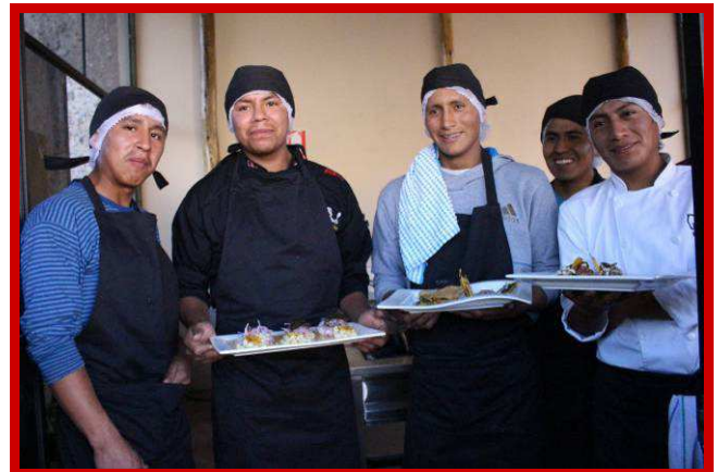
Eerlijk zullen we alles delen!

kans, want voor het eerst in mijn leven heb ik het gevoel dat ik vooruit kom en dat ik iets van mijn leven kan gaan maken! Ik werk iedere dag van 16.00 uur tot 24.00 uur en van 08.00 uur tot 16.00 uur volg ik de lessen. Ik heb aan de leraar gevraagd of ik een half uurtje eerder de lessen mag verlaten, zodat ik toch nog op tijd op mijn werk ben. Bij Mama Alice heb ik nieuwe vrienden leren kennen. Veel klasgenoten gebruiken geen marihuana, terwijl ik voorheen dacht dat dit normaal was en dat iedereen dat deed. In het begin kwam ik regelmatig niet opdagen tijdens de lessen, omdat ik me heel onzeker voelde. Maar nu heb ik bij Mama Alice vrienden die niet roken, vrienden die me aanmoedigen, waardoor ik me iedere dag nog meer inzet. Ook de leraar steunt ons en motiveert ons om door te gaan, geeft ons advies en we kunnen altijd op hem rekenen. Ik ben veranderd en wil er alles uithalen wat erin zit, kom op tijd naar de lessen, verzorg mezelf en bestudeer de recepten goed.