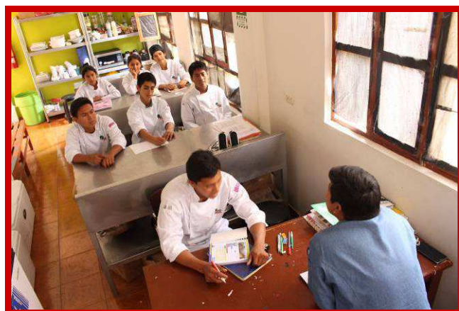
Dankzij de koksopleiding een nieuwe kans, een toekomst.

Zoals jullie in mijn nieuwsbrief van juli jl. hebben kunnen lezen zijn we begin juli met een koksopleiding voor een groep kansarme straatjongeren gestart. De leerlingen van de naaiopleiding zijn er maar wat trots op dat zij de mutsen en schorten voor de koks in spe hebben mogen maken. De koksopleiding heeft de toepasselijke naam "Buen Provecho" gekregen. Dit betekent: "Smakelijk eten".