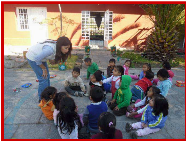
Jong geleerd is oud gedaan.