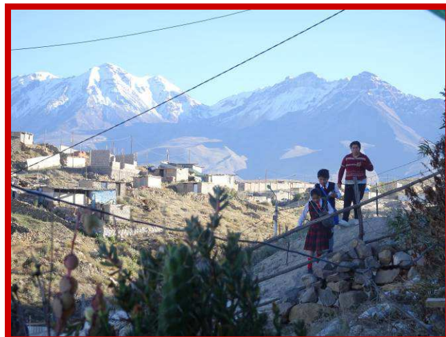
Kinderen moeten vaak ruim een uur lopen naar school.

de geschiedenis zich herhalen en zullen zij hetzelfde gedrag doorgeven aan hun toekomstige kinderen.