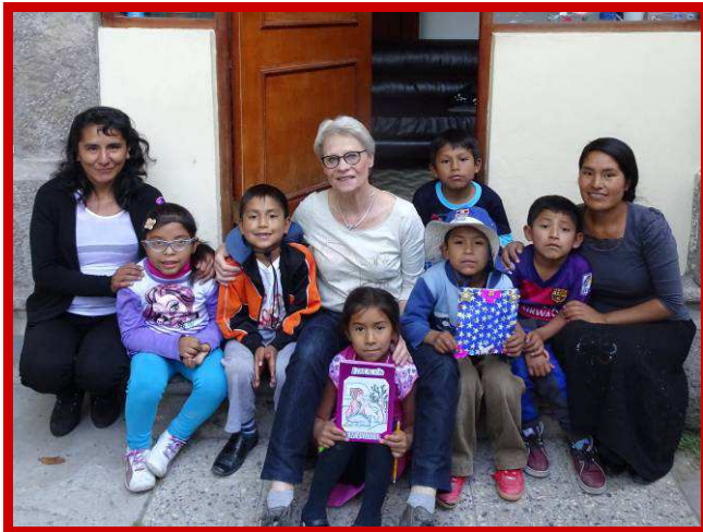
Samen met de kinderen bouwen aan een betere toekomst.

Het einde van het jaar is in zicht en dat is altijd een mooi moment om terug te kijken op het afgelopen jaar. Graag wil ik jullie allen intens bedanken voor jullie trouwe steun, waardoor wij vele kansarme kinderen in Arequipa en Ayacucho kansrijker kunnen maken. Velen van jullie steunen ons werk al vanaf het eerste uur. Enkele donateurs hebben zich zelfs verbonden voor een periode van 5 jaren. Hier ben ik ontzettend blij mee, zeker gezien het feit dat het aantal donaties ieder jaar terugloopt.