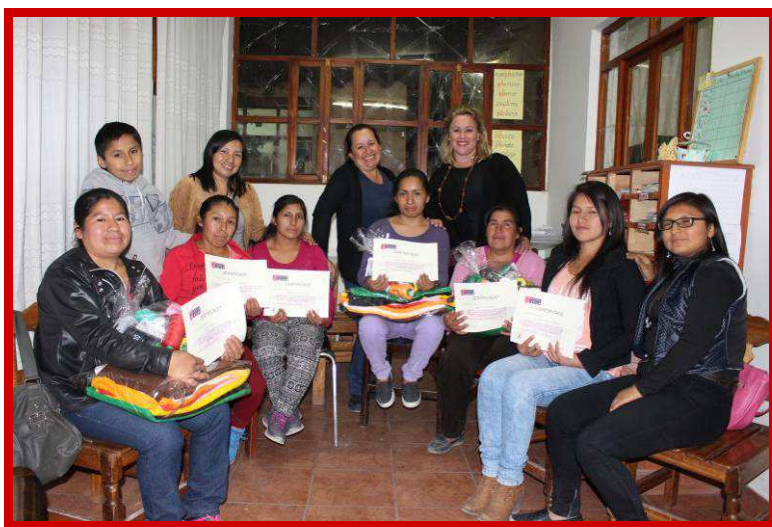
Vol trots tonen de alleenstaande moeders hun diploma.