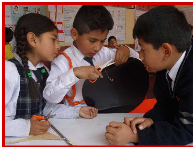
In het leven staat het stoplicht soms ook op zwart.

Nu ik bijna aan de eindstreep van mijn studie ben gekomen kan ik jullie zeggen, dat het niet gemakkelijk is om een studie te combineren met twee banen. En zeker niet om daarnaast ook nog je eigen dagelijkse leven te leiden. Maar gezien het resultaat ben ik wel ongelooflijk blij dat ik deze kans heb benut. Ik geloof dat hierdoor mijn werk kwalitatief verbeterd is. Het is misschien nog niet perfect en soms bereik ik nog niet helemaal waar ik op hoop. Maar ik weet wel zeker dat ik een kleine positieve bijdrage kan leveren aan het leven van deze kinderen en hun ouders en dat geeft me een goed en tevreden gevoel.