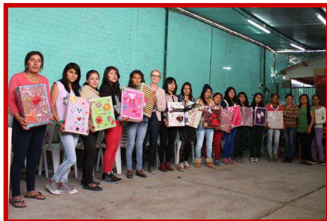
De tweede groep leerlingen toont hun eerste werkstuk.

Toen ik 14 jaren was leerde ik een jongen van 22 jaren kennen. In eerste instantie mocht hij me niet, maar later begon hij me te plagen en werden we een stelletje. Toen ik erachter kwam dat ik zwanger was vertelde ik dit tegen hem. Hij antwoordde dat we niet zouden gaan samenwonen en dat hij met mijn ouders zou gaan praten, maar dit heeft hij nooit gedaan. Toen ik 6 maanden zwanger was hoorde ik dat hij al een vrouw en een zoontje heeft. Mijn ouders waren woedend toen ze erachter kwamen dat ik zwanger was en wilden aangifte doen bij de politie. Maar ik heb me hier tegen verzet, omdat mijn vriend zei dat hij zijn vrouw zou verlaten en met mij samen zou gaan wonen. Mijn ouders hebben me toen uit huis gezet.