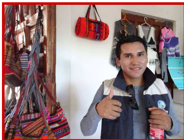
Een ontmoeting met de leraar van de gidsenopleiding.