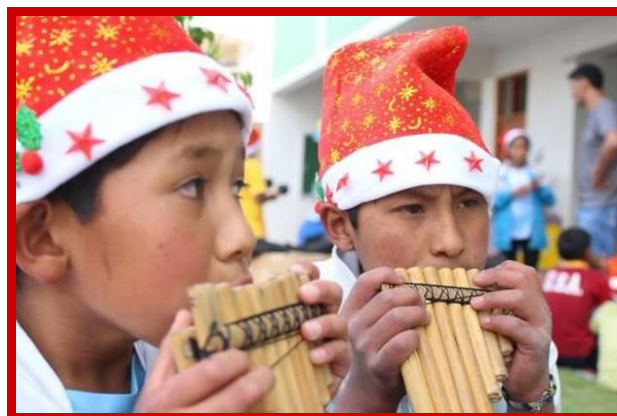
Een Gelukkig Kerstfeest vanuit Peru voor jullie allen.

Ik hoop intens dat deze nieuwsbrief voor u opnieuw aanleiding is om Kinderen van de Zon te steunen. Graag ontvang ik uw bijdrage op: