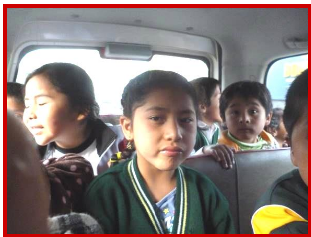
Samen in de bus, ja, gezellig!

Helaas is de kinderbibliotheek alleen op zaterdagen open van 10.00 uur tot 12.00 uur. Vrijwilligers lezen dan sprookjes voor, doen poppenkast en andere activiteiten met de kinderen. Het probleem van dit tijdstip is dat de ouders van onze kinderen moeten werken en de kleintjes wonen heel ver weg van het centrum van de stad. Daarnaast is het probleem dat de reis naar het centrum geld kost, geld dat de ouders niet kunnen missen. Dat is de reden waarom deze kinderen nooit naar de bibliotheek gaan. Hieraan moet ik nog toevoegen dat de kinderen niet eens van het bestaan van deze bibliotheek af wisten en ook niet dat er een speciale kinderruimte voor hen is.