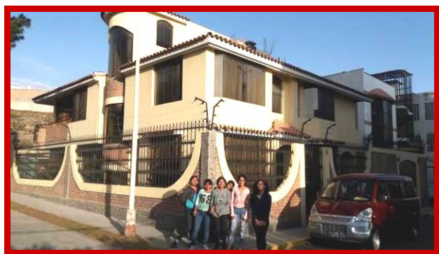
De meisjes bewonderen hun nieuwe onderkomen.