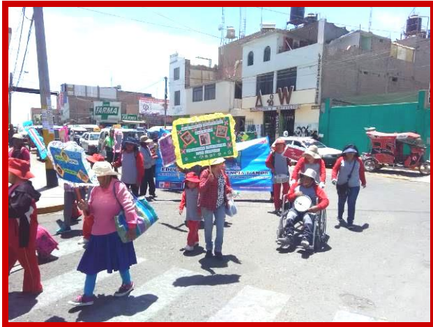
Een muzikale demonstratie door de speciale kinderen.

die de zorg over hen dragen en al op hoge leeftijd zijn, moet ik er niet aan denken wat er van deze kinderen terecht zal komen.