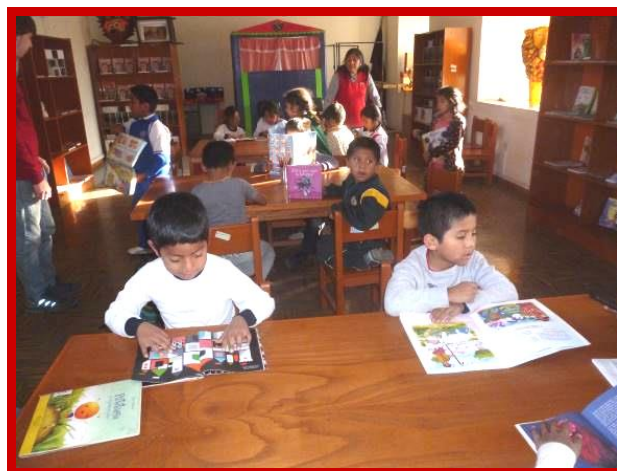
Wat een feest, zoveel boeken die voor het grijpen liggen!

kinderen tussen de 5 en 9 jaar en ik kan jullie vertellen dat dit een hele happening is. Om iedereen in het busje te krijgen was nog een hele uitdaging, aangezien de kinderen bijna nooit buiten het project komen of in het openbaar vervoer zitten. De reis naar het centrum benutte ik om hen uit te leggen hoe ze zich moesten gedragen in de bibliotheek, maar ik moet jullie eerlijk bekennen dat de kinderen nauwelijks aandacht voor me hadden. Ze hingen met hun mondjes open voor de ramen van het busje, want wat is er spannender dan in een busje zitten dat helemaal alleen voor jou rijdt. Als ze al ooit in een bus zitten zijn die overvol en worden ze bijna vertrapt door de grote menigte en zitten de grote mensen voor het raam.