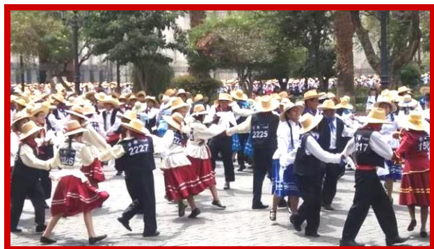
Maar liefst 2.500 dansparen namen deel aan de wedstrijd.

zorgen van alledag, je mee te laten voeren op het ritme van de muziek en in de bewegingen, vrij zijn. Het is echt een passie voor mensen zoals ik die van dansen houden. Dansen is echt mijn lust en mijn leven! Als ik dans voel ik me uniek en vergeet ik alles om me heen.