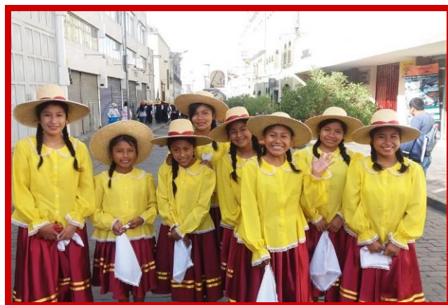
De meisjes vol spanning voor de dansuitvoering.