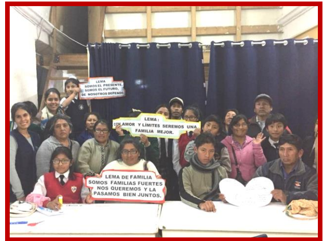
Met liefde en grenzen worden we een beter gezin.

helpen. Om hem toch bezig te houden heb ik hem verplicht in een restaurant te gaan werken. Al vanaf dat ik kinderen heb, heb ik problemen met hen. Vooral met mijn zonen, want die begreep ik helemaal niet.