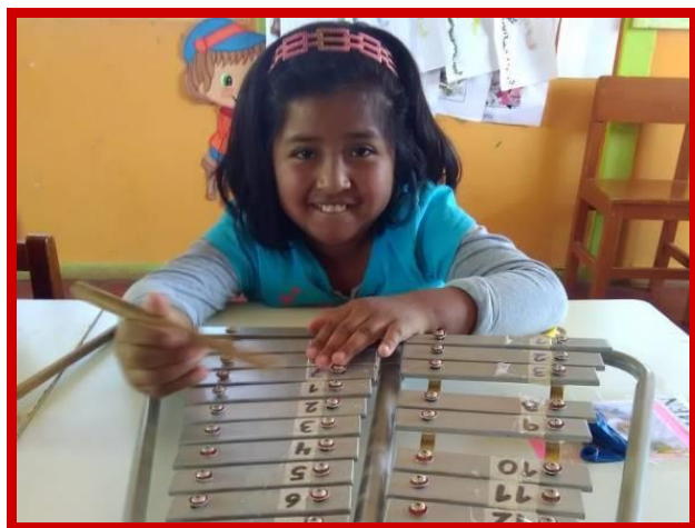
Een vrolijk muzikantje in Majes.

deren onderwijs te blijven geven, in de hoop dat ik het lokaaltje waar we al vele jaren werken mag blijven gebruiken. Een lokaaltje zonder water en riolering. De verslagenheid onder de ouders is groot, want inmiddels realiseren zij ook dat juist voor hun speciale kinderen door hun beperking onderwijs nog veel belangrijker is dan voor hun andere kinderen. Het is mijn taak als directrice om deze kinderen en hun ouders te steunen, maar het grote probleem is dat ik er geen idee van heb wat er in het nieuwe schooljaar gaat gebeuren. Ik ben de ouders erop aan het voorbereiden dat ook zij zullen moeten knokken voor het voortbestaan van ons schooltje. De uiteindelijke beslissing hangt helemaal van het Ministerie van Onderwijs af.