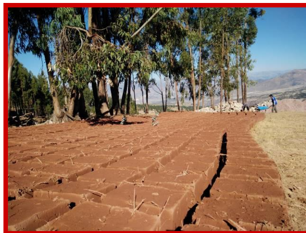
Leemblokken van eigen terrein.