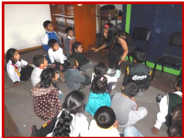
De kinderen zijn vol aandacht voor de verhalenvertelster.

kinderen waren zo bang iets te missen dat ze ook het boek van de andere kinderen wilden zien of ze lazen aan elkaar een verhaaltje voor.