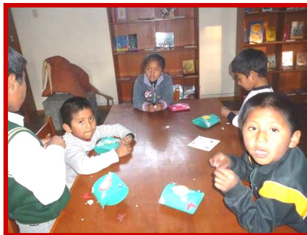
Na afloop nog heerlijk samen knutselen in de bieb.