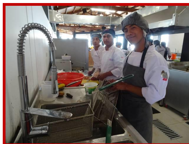
De koks genieten in ons nieuwe opleidingscentrum.

Op een dag viel de politie bij het Internetcafé binnen, ze pakten ons op en namen ons mee naar huis. Ik wilde niet meegaan en smeekte hen huilend om me niet mee naar huis te nemen, omdat mijn vader me zou slaan. Toen ik thuiskwam sloeg mijn vader me met een ketting, ze waren helemaal niet blij me te zien. Mijn vader zei me dat ik moest gaan werken en dat ik voortaan alleen het huis uit zou mogen om te studeren en te werken. Ik studeerde tot het tweede jaar van de middelbare school en bleef mijn vriendschap met mijn straatvrienden onderhouden. Als mijn vader ging drinken, ontsnapte ik naar het Internetcafé. Ik verliet ons huis niet meer, want ik me herinnerde de momenten dat we koud en hongerig waren en om die reden besloot ik thuis te blijven wonen.