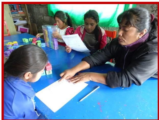
Met Individueel Onderwijs redden ook deze kinderen het.

vertel ik bij gelegenheid tegen mijn eigen kinderen, zodat ze alles wat ze in huis hebben leren waarderen, zoals: de liefde van de ouders, driemaal daags een maaltijd, een warm gezin, de zorg voor hun gezondheid, opleiding en welzijn. Ik leer hen ook om hun medemensen en degenen die het nodig hebben naar beste vermogen te helpen, zodat ze een goed gevoel in hun hart hebben en dezelfde voldoening voelen die ik voel bij het helpen van anderen.