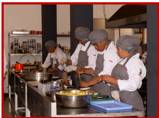
Koken is een daad van liefde, opdienen de ultieme kunst.

mijn vader geduwd had, verliet ik het huis met mijn straatvrienden. Ik was zo wanhopig, dat ze me marihuana aanboden zodat ik rustiger zou worden. Niemand kon me meer pijn doen. Gedurende enkele dagen zat ik op straat te roken met mijn vrienden en ik ging alleen naar huis om te eten. Mijn moeder hilde, gaf me te eten en dan ging ik weer weg. Toen ik op een dag thuis ging eten ontmoette ik mijn vader in het huis, maar hij zei niets tegen mij. Mijn vader wist dat hij me niet meer kon verslaan. Ik verliet school en ik ging alleen naar huis om te eten en te slapen en daarna vertrok ik om plezier te maken met mijn vrienden.