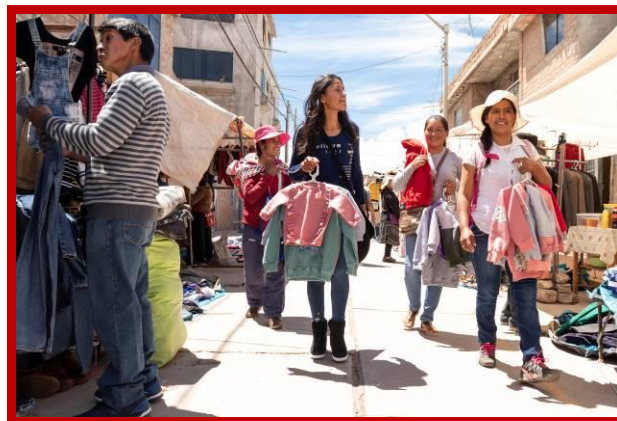
De moeders leren hun producten te verkopen op de markt.

een renteloze lening zouden krijgen en begeleiding in het productie- en ondernemingsproces. Ik had tijd nodig om te verwerken wat er gebeurde, om hen uiteindelijk te begrijpen, te steunen, enthousiasmeren en motiveren, dat zij met deze eenmalige kans in hun leven hun situatie ten goede zouden kunnen keren en om hen hun angst te leren loslaten.