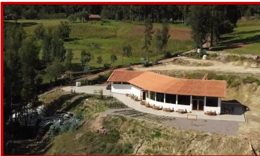
Een nieuwe toekomst voor velen, met dank aan alle donateurs.