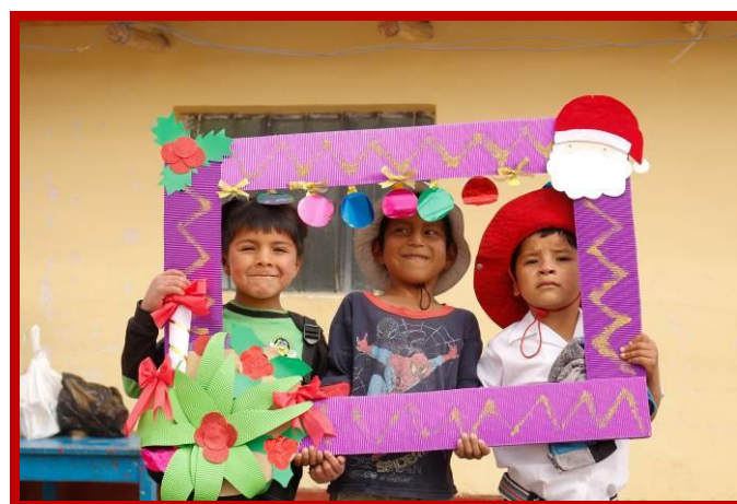
Een Gelukkig Kerstfeest vanuit Peru voor jullie allen.

Ik hoop intens dat deze nieuwsbrief voor u opnieuw aanleiding is om Kinderen van de Zon te steunen. Graag ontvang ik uw bijdrage op: