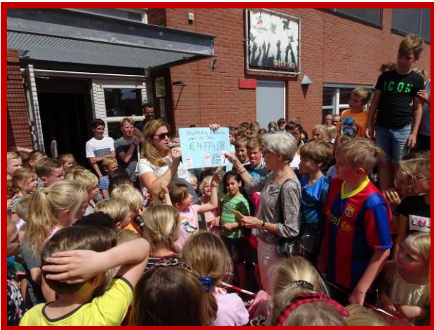
Een zonnige dag voor de Kinderen van de Zon.

Het einde van het jaar is in zicht en dat is altijd een mooi moment om terug te kijken. Graag wil ik jullie allen intens bedanken voor jullie trouwe steun, waardoor wij vele kansarme kinderen in Ayacucho en Arequipa kansrijker kunnen maken. Velen van jullie steunen ons werk al vanaf het eerste uur. Enkele donateurs hebben zich zelfs verbonden voor een periode van 5 jaren. Hier ben ik ontzettend blij mee, zeker gezien het feit dat het aantal donaties ieder jaar terugloopt. Zonder iemand tekort te willen doen, benoem ik een paar bijzondere donaties, die ik dit jaar heb ontvangen. Ontroerend zijn de donaties van lieve mensen, die bij hun huwelijksjubileum of een speciale verjaardag geen persoonlijke cadeautjes maar een donatie voor Kinderen van de Zon hebben gevraagd. Het is hartverwarmend dat mensen voor hun overlijden de wens uitspreken bij hun uitvaart i.p.v. bloemen een donatie voor onze Peruaanse snottebellekes te willen. Het raakt me iedere keer weer dat zij hierdoor met het einde van hun leven een nieuw leven schenken aan kansarme jongeren, een toekomst.