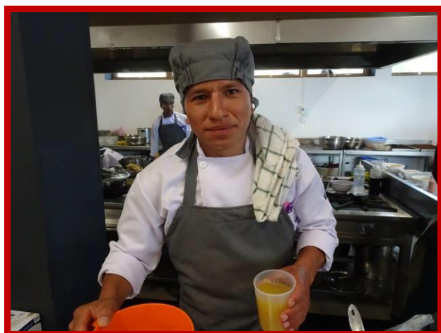
De koksopleiding, het begin van een nieuw leven.

klein kind van ongeveer 5 jaar was ik er getuige van dat mijn vader mijn moeder mishandelde en haar bewusteloos achterliet. Er was geen geld thuis, want mijn vader werkte alleen om te drinken. Als mijn vader om 16.00 uur nog niet thuis was, betekende dit dat hij met zijn vrienden aan het drinken was, dat hij dronken zou thuiskomen en ons zou mishandelen. Daarom verstopte ik me onder het bed en smeekte God dat mijn vader me niet zou vinden. Als mijn vader dan thuiskwam, begon hij te schreeuwen en mijn moeder te slaan. Mijn zussen probeerden haar te verdedigen, met als resultaat dat hij ons allemaal sloeg.