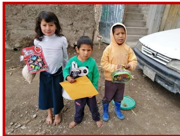
Voedsel en leer- en spelmaterial voor de kinderen.

Ook de bevolking van Quinoa was ons zeer dankbaar en stuurde veel lieve berichtjes. Daar hebben we door de corona uitbraak helaas ons opleidingsrestaurant moeten sluiten. En dat terwijl we juist met een nieuwe enthousiaste groep koks in spe een nieuwe koksopleiding waren gestart. Na het sluiten van ons restaurant hebben we onze vlees- en visvoorraad aan de armste gezinnen van Quinoa geschonken, om ook hen een hart onder de riem te steken in deze moeilijke tijd. Ook hier zullen we ons hoofd over moeten gaan breken hoe we na de totale lockdown onze koksopleiding weer kunnen hervatten.