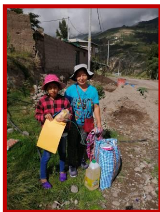
De eerste voedselpakketten worden rondgebracht.

We waren dan ook erg opgelucht toen Kinderen van de Zon hun bezorgdheid over deze situatie uitsprak en onmiddellijk een budget beschikbaar stelde om voedsel voor deze gezinnen te kunnen kopen. Inmiddels hebben we die boodschappen gedaan, de pakketten zijn gemaakt en enkele van onze teamleden zijn de pakketten in Yanama