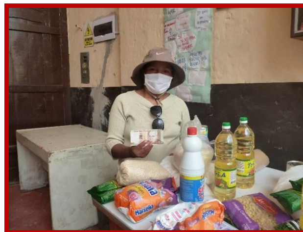
De steun is ook voor dit gezin een geschenk uit de hemel.