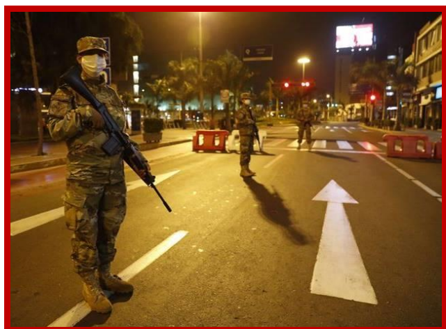
Politie en soldaten waken over de quarantaine regels.

Met deze toestemming was het tijd om in actie te komen. Het was vreemd en beangstigend om de veiligheid van ons huis te verlaten en de onveiligheid van de straat op te zoeken. De lege straten, zonder verkeer, en het zien van de angst op de met maskers bedekte gezichten van de leveranciers in de bevoorradingscentra, confronteerde mij met de realiteit waarin we nu leven. De afstand die ik bewaarde, die normaal gesproken als minachting had kunnen worden beschouwd, is nu het gebaar van solidariteit dat elke Peruaan eraan herinnert dat onze manier van leven is veranderd en we weten niet hoe lang dit zal duren.