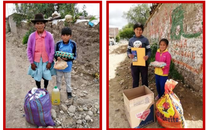
Grote dankbaarheid en opluchting bij de gezinnen.

We zijn ons er ook van bewust dat we, voor het ontwikkelen van deze virtuele lessen, veel dingen nodig zullen hebben, zoals laptops, Internet, een technicus die helpt bij de installatie van de computers en toegang tot virtuele lesprogramma's. We hopen intens donaties te krijgen voor de aanschaf van laptops, zodat ook onze kinderen, net als vele andere kinderen, de virtuele lessen kunnen gaan volgen en dat onze leerkrachten hen kunnen begeleiden met het maken van hun huiswerk.