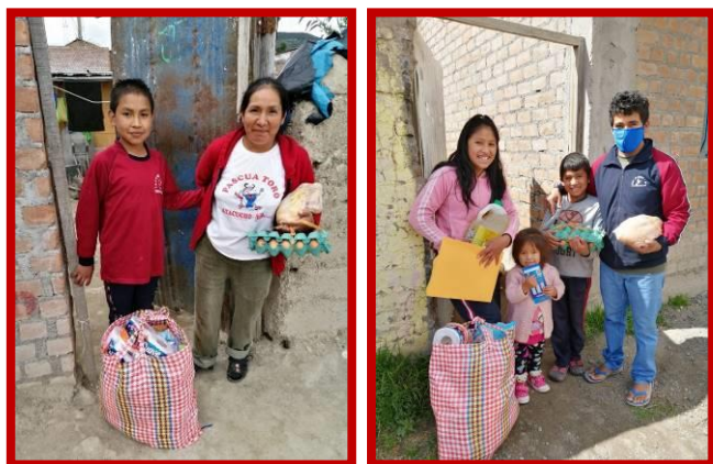
Blijde gezichten bij ontvangst eerste voedselpakket.