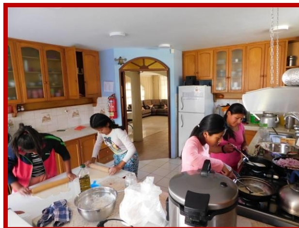
De meisjes helpen mee met het koken van de maaltijden.