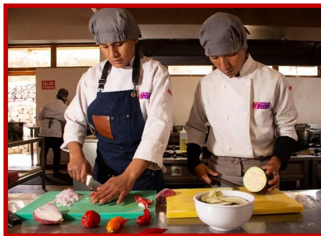
Het eindexamen is in zicht.

Ik herinner me dat ik ging werken zodra de schoolvakanties begonnen, om mijn schoolbenodigdheden voor het nieuwe schooljaar te kunnen kopen. Dat jaar ging ik met enkele familieleden werken in Lima en toen ik iets verkocht, betaalde de klant me met vals geld. Toen mijn baas hier achterkwam kreeg ik twee dagen niets te eten en liet hij me op straat slapen. Ik was erg bang en ik huilde als nooit tevoren. Ik haatte mijn vader omdat hij ons had verlaten; ik vroeg me af waarom hij ons had verlaten, waarom hij een ander gezin had gekregen en voor hen werkte en ons was vergeten; ik vroeg me af waarom ik moest werken en ik niet net als andere kinderen lekker kon spelen; waarom ik nooit met kerst een cadeautje kreeg. Telkens als ik moe was, dacht ik eraan dat ik moest werken om geen honger te hebben en om iets te eten mee naar mijn huis te kunnen nemen.