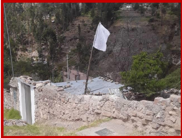
Een witte vlag, het teken van overgave, van honger.

Als team hebben we besloten om 10% van ons maandsalaris in een potje te doen, om financiële steun te kunnen bieden aan onze leerlingen of iemand van het team als zij corona krijgen en geen geld voor de behandeling hebben.