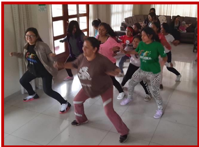
De meisjes genieten van de digitale danslessen.

De scholen zijn al twee maanden gesloten en zoals het er nu uitziet zullen de kinderen tot het einde van het jaar geen les meer krijgen. Zoals jullie in de verhalen van Flor en Elba lazen is de honger onder het volk groot. Daarom zijn we begonnen met het verspreiden van voedselpakketten voor de meest wanhopige gezinnen. Een van de teamleden zei hierover het volgende: "Het was een prachtig en emotioneel moment om onze gezinnen, kinderen en adolescenten weer te zien. Een ontmoeting en gevoel dat niet in woorden is uit te drukken, enerzijds de vreugde hen te kunnen helpen en anderzijds het verdriet dat ze ons niet met een liefdevolle omhelzing konden begroeten. Het was voor hen een emotioneel moment om een voedselpakket te krijgen, hun ogen begonnen te stralen en er verscheen een glimlach op hun gezicht. Ik merkte dat ze zó blij waren hun problemen eindelijk met iemand te kunnen delen. Het was alsof zij water in de woestijn hadden gevonden. Vandaag heb ik geleerd het leven nog meer dan ooit te waarderen".