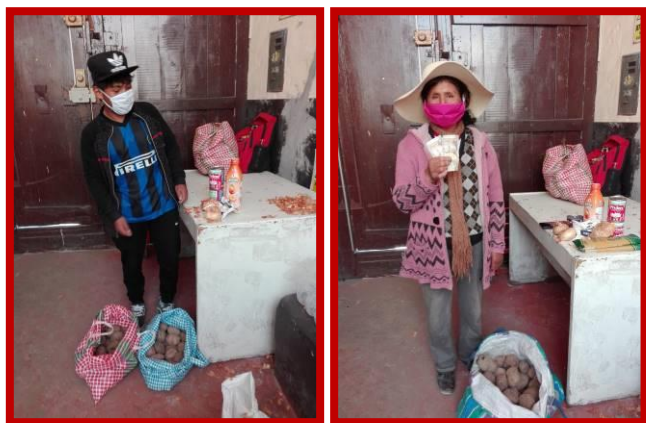
Ouders komen hun pakket ophalen bij Hogar de Cristo.

een koelkast in huis hebben maakt geen deel uit van de realiteit van deze gezinnen, omdat 50% van de Peruaanse bevolking geen koelkast heeft waar ze voedsel in kunnen bewaren. Een koelkast is voor hen veel te duur en dit betekent dat ze dit apparaat op krediet zouden moeten kopen. Maar het afsluiten van een lening is hier in Peru ontzettend duur. Bovendien moeten ze dan elektriciteit in huis hebben, wat voor de meeste gezinnen ook onbetaalbaar is. En als iemand hen een oude gebruikte koelkast schenkt, wordt deze gebruikt als voorraadkast omdat het gebruik ervan de prijs van hun elektriciteitsrekening verhoogt.