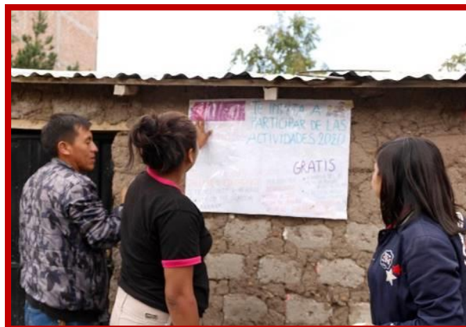
Wat had het team weer zin in het nieuwe schooljaar!

Na de zomervakantie, eind februari, stond het hele Mama Alice team weer klaar om aan de slag te gaan met de kinderen in Yanama. We hadden 2019 geëvalueerd en de doelstellingen en programma's voor dit nieuwe schooljaar waren klaar. De scholen zouden enkele dagen later hun deuren wopen. Het team hing posters op vele plekken in de wijk Yanama om de kinderen uit te nodigen voor onze activiteiten. Wat waren onze leerlingen enthousiast ons weer te zien! Zij hadden ons net zo gemist als wij hen.