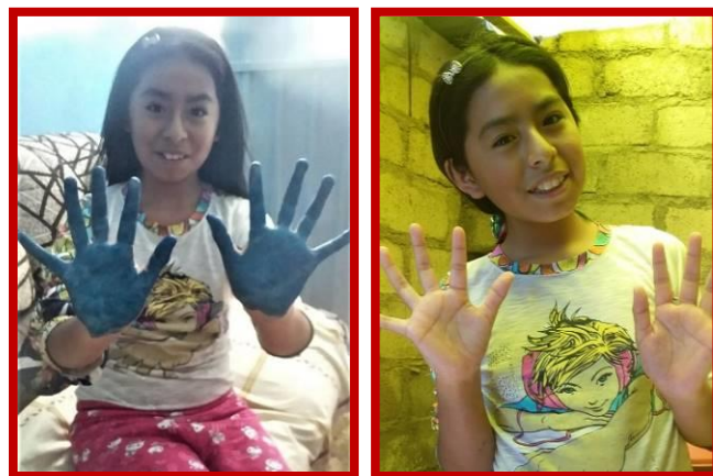
Digitale workshop van Flor over coronahygiëne.

veel mogelijk te verlichten. Maar zeker ook om naar hen te luisteren, omdat de angst zichtbaar is op hun gezichten. Ook dat is onderdeel van ons werk, dat we onszelf in hen herkennen, in die anderen, die vaak onzichtbaar zijn en hun leed met berusting ondergaan.