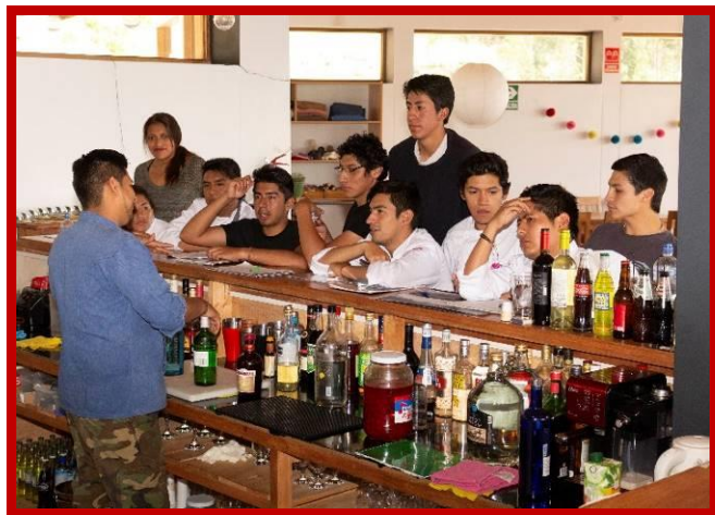
Een nieuwe lichter enthousiaste koks in spe.

Onderstaand deel ik de verhalen van ONG Mama Alice in Ayacucho met jullie. Gelukkig hadden we net voor de uitbraak van het coronavirus de eerste koksopleiding in ons nieuwe opleidingscentrum afgerond.