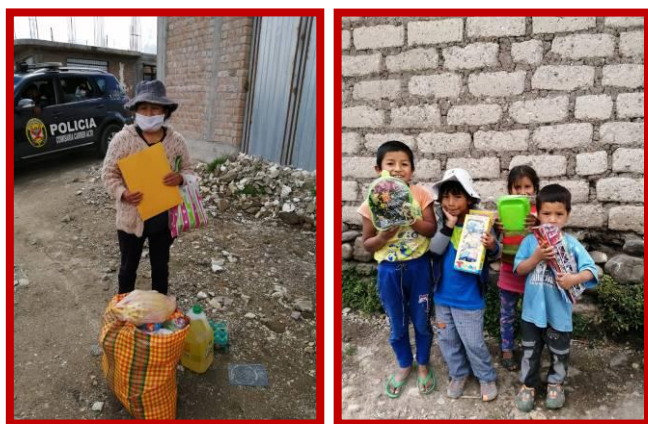
In deze coronatijd is de politie echt onze beste vriend.

ongeveer 700.000 inwoners. Vanuit deze wetenschap probeerde de regering zo goed en slecht als het kon het land voor te bereiden, om de coronapandemie het hoofd te kunnen bieden. Maar door het feit dat we een niet goed gedisciplineerd land zijn, werden ook snel de eerste besmettingsgevallen in alle districten van Peru gemeld. Ayacucho was een van de laatste 10 districten waar het coronavirus opdook, maar de minachting voor de oproep van de overheidsinstantie om in huis te blijven heeft geleid tot een toename van het aantal infecties. Onze grootste zorg op dit moment is dat veel mensen besmet zijn, waardoor er steeds meer slachtoffers vallen. Het meest trieste is dat de hele straathandel is stil komen te liggen en mensen hun baan verliezen, veel bedrijven zijn lamgelegd en/of failliet gegaan. Daarom is de werkloosheid nu nog groter en zijn er talloze gezinnen die geen geld meer hebben om eten te kopen. Als er in Ayacucho te veel mensen ziek worden zullen ze niet kunnen worden geholpen vanwege de beperkte middelen in de gezondheidszorg en zullen we moeten hopen en bidden dat we deze ziekte thuis weten te overleven. De situatie voor veel gezinnen is onhoudbaar geworden. Bij gebrek aan inkomsten kunnen de gezinnen de huur niet meer betalen en worden uit huis gezet. Een groep van 1.000 mensen is met gevaar voor eigen leven aan een voettocht van 300 kilometer naar hun geboortedorp begonnen, in de hoop dat zij bij familie kunnen intrekken en daar gratis kost en inwoning krijgen.