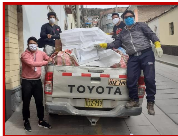
Voedselpakkettentransport door onze teamleden.

vanwege het negeren van de regels door de bevolking en ten tweede vanwege het gebrek aan beschermende materialen waardoor het personeel het risico loopt op besmetting. In de afgelopen dagen zijn veel personeelsleden van de sociale ziektekostenverzekeringsposten positief getest op het coronavirus en men roept nu eindejaarsstudenten van de opleiding gezondheidswetenschappen op om zich te melden.