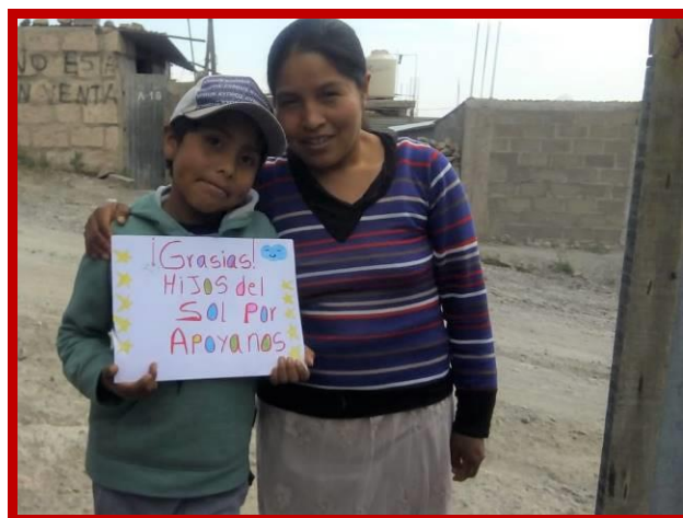
Dank je wel Kinderen van de Zon voor jullie steun!