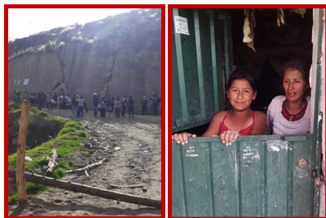
Wegblokkades en gezinnen in quarantaine in Yanama.

Het gezondheidssysteem in Peru is niet goed. Lima, de hoofdstad van Peru, heeft wat reanimatie- en beademingsapparaten die iets geavanceerder zijn dan in andere grote steden, maar hier in Ayacucho is ons gezondheidssysteem erg slecht. We hebben vier beademingsapparaten voor een bevolking van