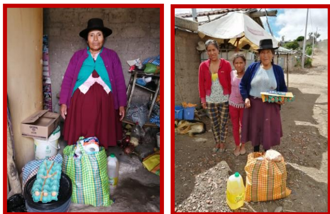
Wat zijn de gezinnen dankbaar voor onze steun!

straatbeeld verdwijnen; de ongeschoolde arbeiders, straatverkopers en sjouwers zijn, samen met de rest van de burgers, verdwenen van de straat. Terwijl sommige burgers na de presidentiële aankondiging zich naar de supermarkten en markten haastten om voedsel en schoonmaakmiddelen in te slaan, bleven vele anderen verslagen en in totale onzekerheid achter, want als ik vandaag niet werk, heb ik ook geen eten. Bijna 70% van het volk heeft geen vast inkomen, ontvangt geen maandsalaris en leeft van de hand in de tand. Hoe moeten zij alternatieve manieren vinden om te overleven tijdens deze nachtmerrie?